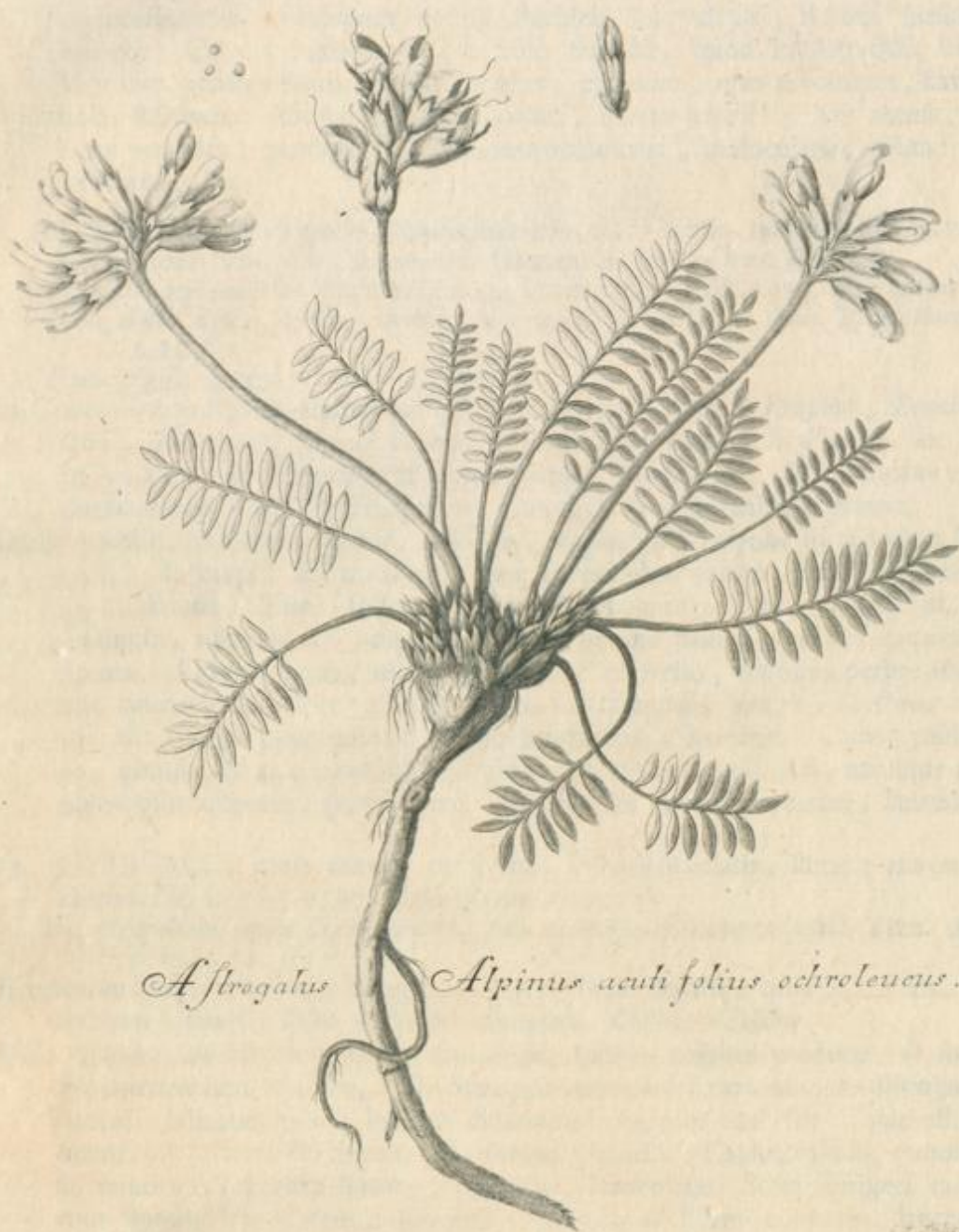
Astrogalus Alpinus acutifolius ochroleucus.