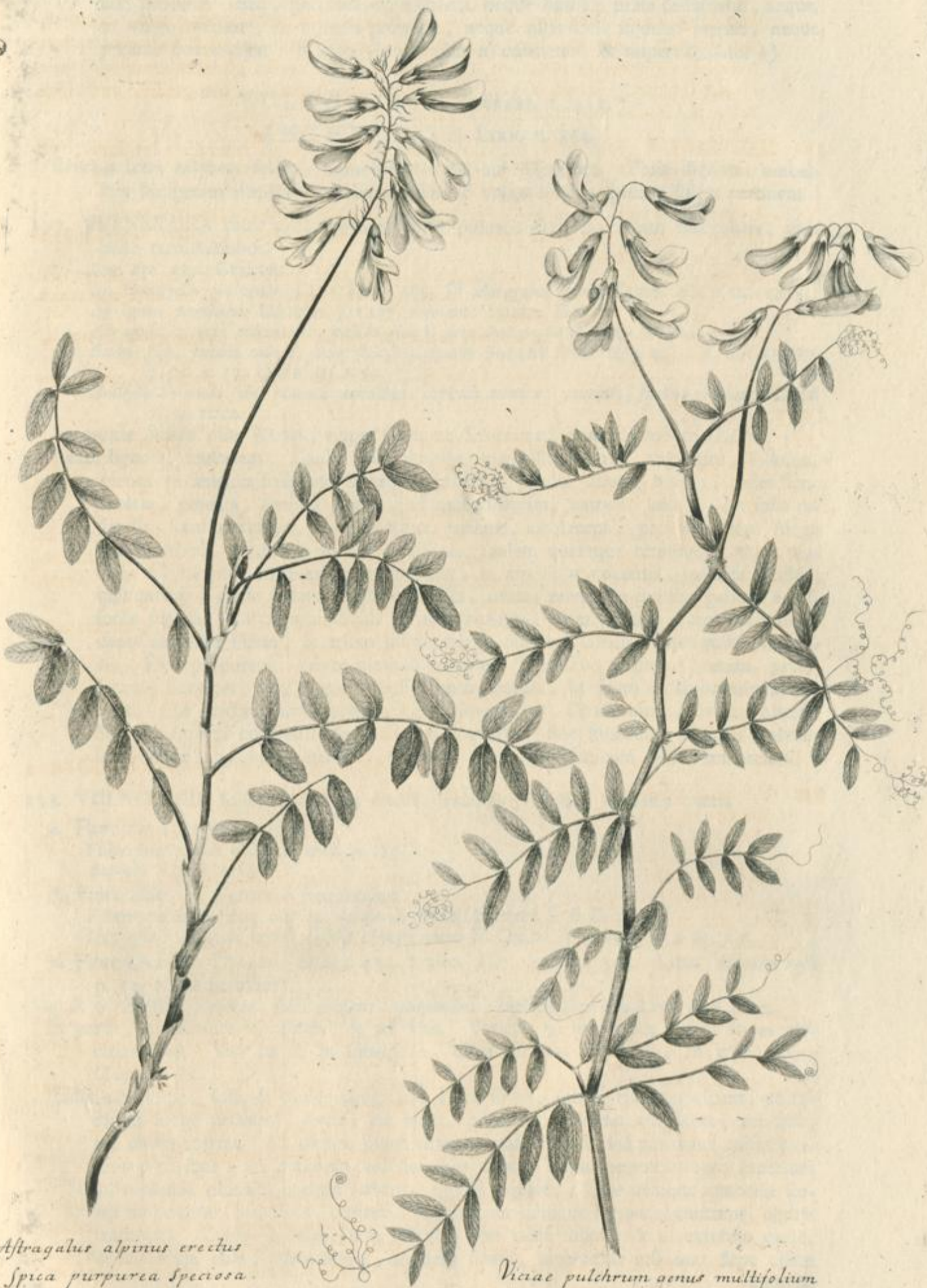
Astragalus alpinus erectus Spica purpurea speciosa.