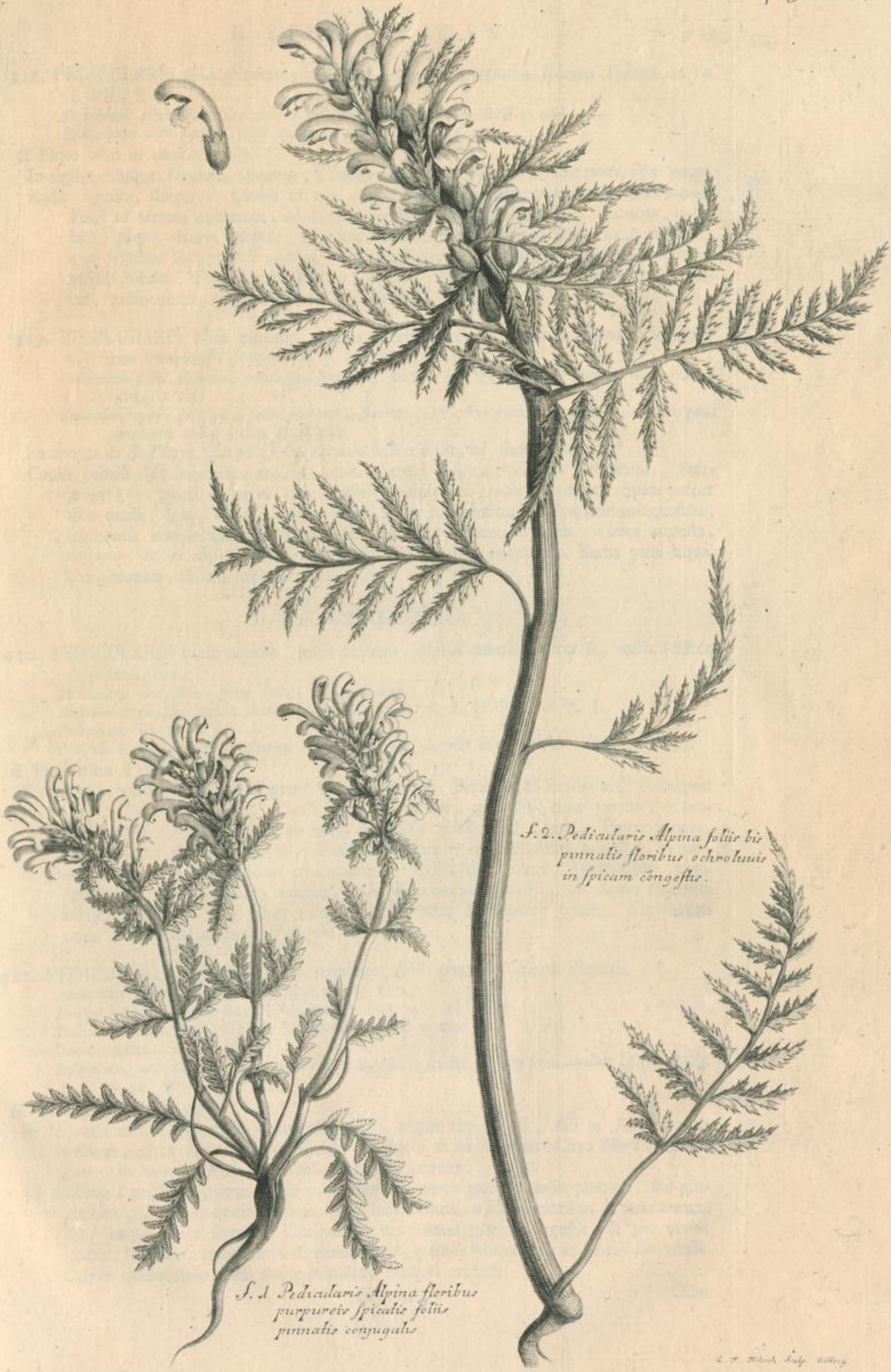
S. 2. Pedicularis Alpina foliis bipinnatis floribus ochroleucis in spicam congestis.