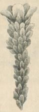
ARETHA caulibus teretibus, foliis imbricatis, floribus sessilibus.