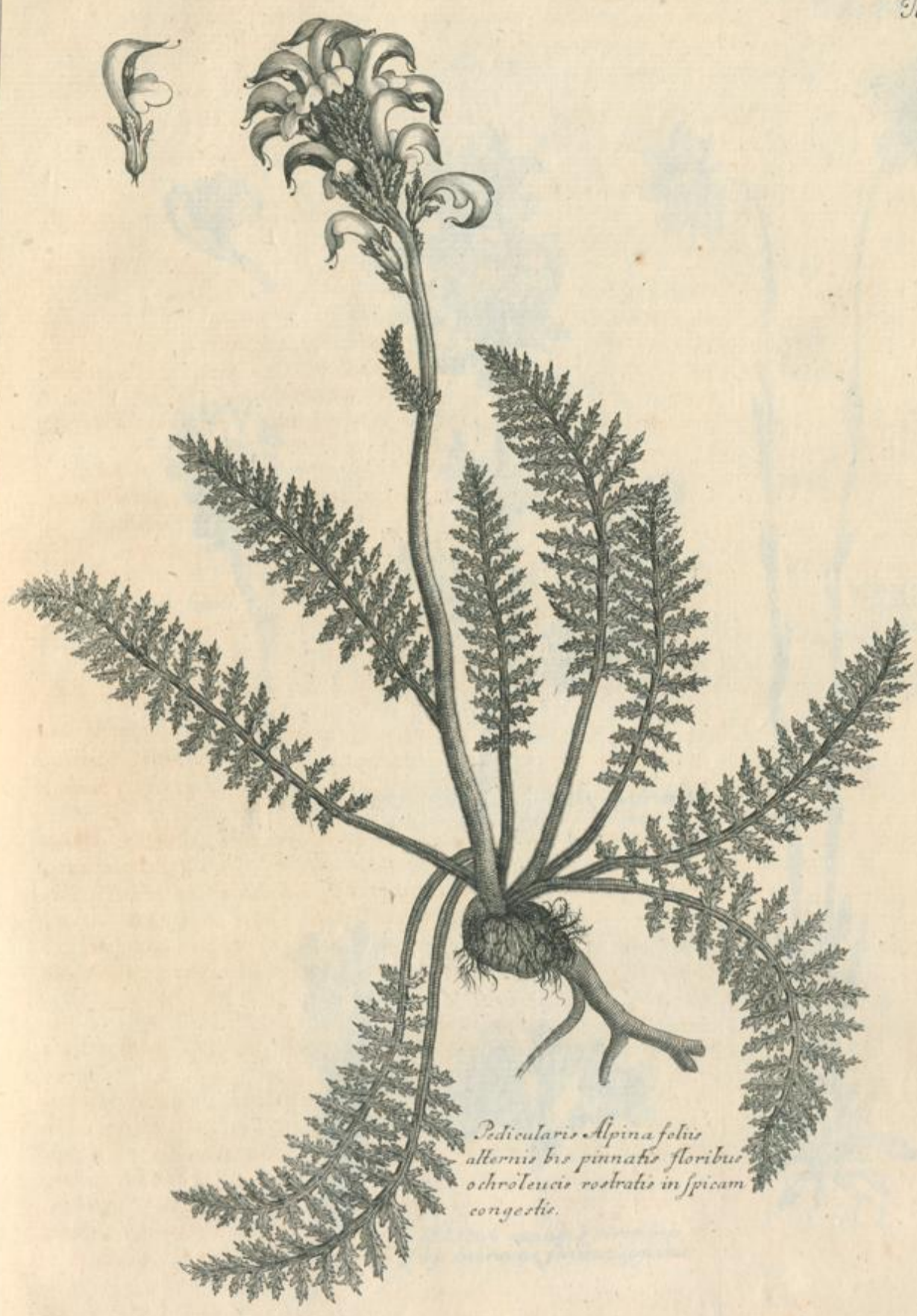
Pedicularis Alpina foliis alternis bis pinnatis floribus ochroleucis rostratis in spicam congestis.