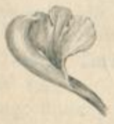
ARETHA villosa scapis unifloris.