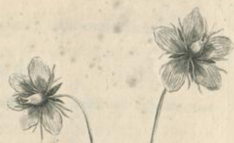
Saxifraga petalis latissimis luteis lineatis.