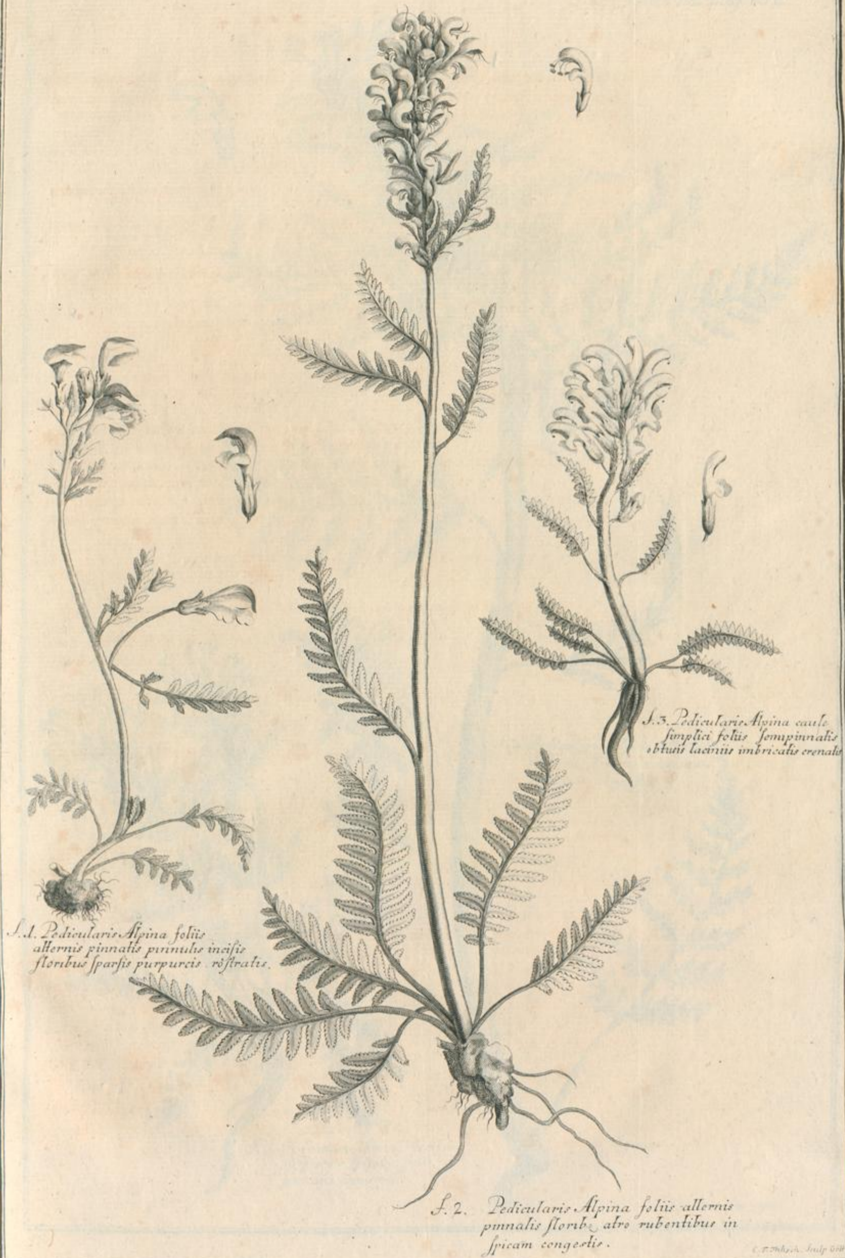
F. 1. Pedicularis Alpina foliis alternis pinnatis pinnulis incisissimis floribus sparsis purpureis rostratis.