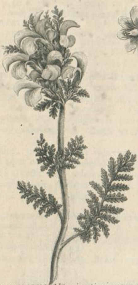
PEDICULARIS foliis pinnatis, pinnarum pinnulis dentatis, obtusis, galea rostrata.