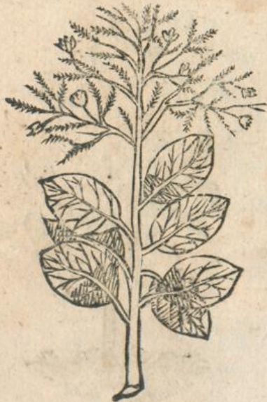
*1285. Cotinus Matth.*