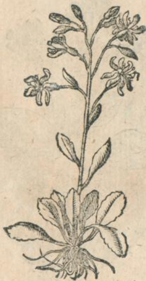
1223. Hoher Steinbrech Lon.