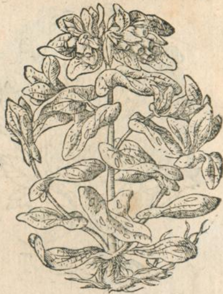
1238. Cerithe major Clus.