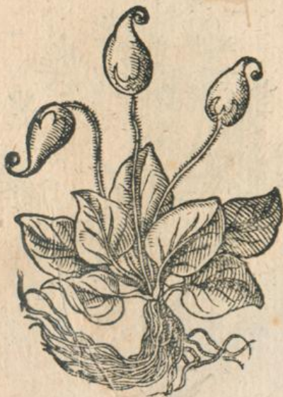
1255. Nardus Indica M.