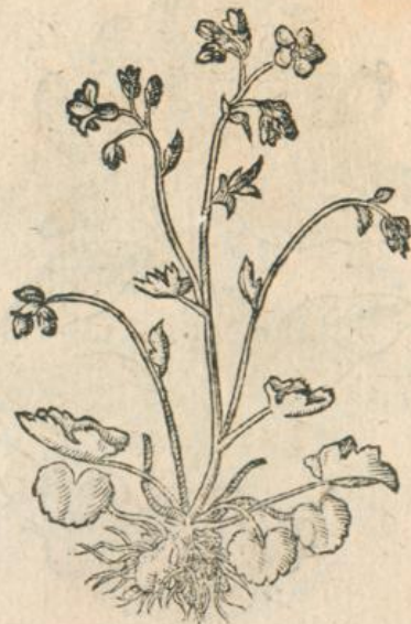
1222. Saxifraga alba.