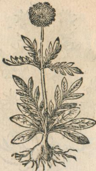
1256. Nardus Indica Lon.