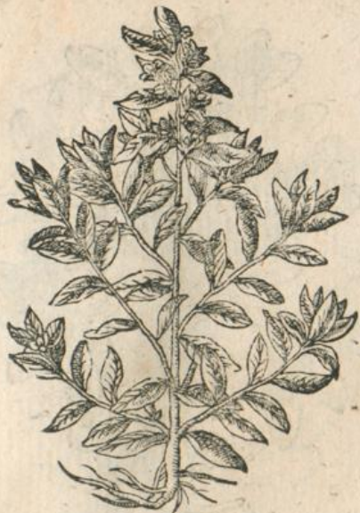
1241. Milium Solis T.