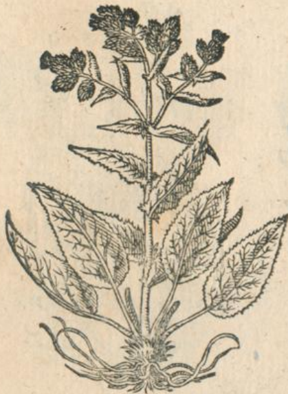
1237. Serratula 2.