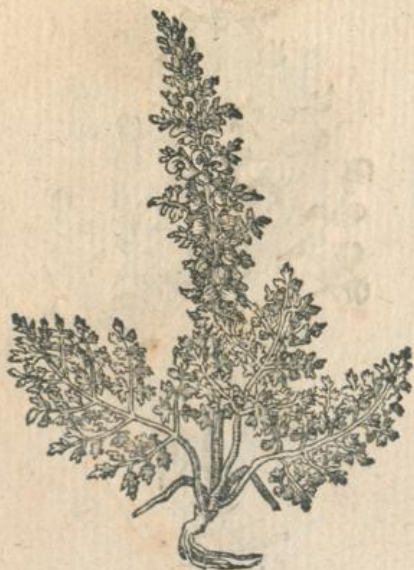
1245. Pedicularis, Rödel. T.