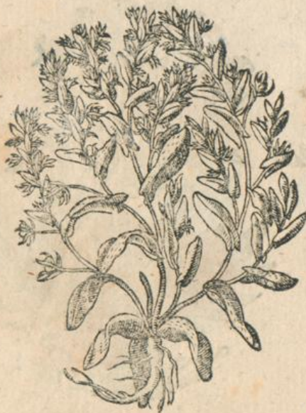
1239. Cerithe minor Ad. L.