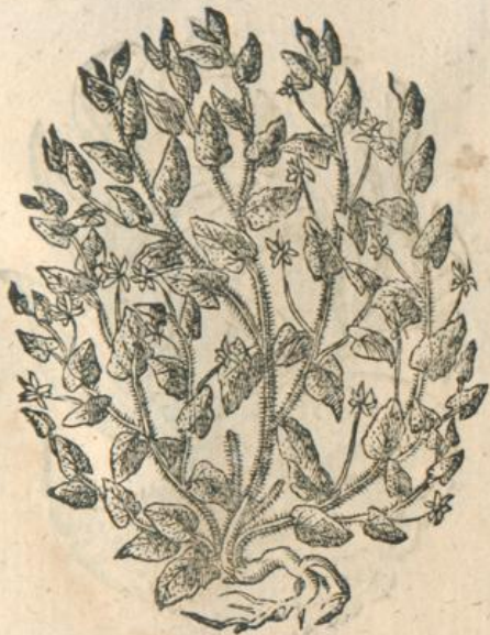
1243. Elatine Matth.