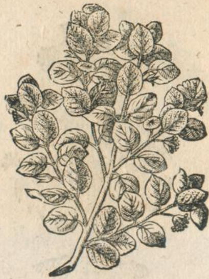
1286. Cistus mas. Lox.