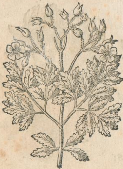
1287. Cistus mas supinus Ob. L.