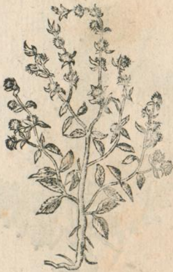
1242. Elatine, Klettenfr. T.