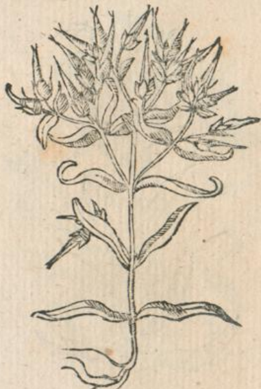
1212. Viscum Indicum Ad. L.