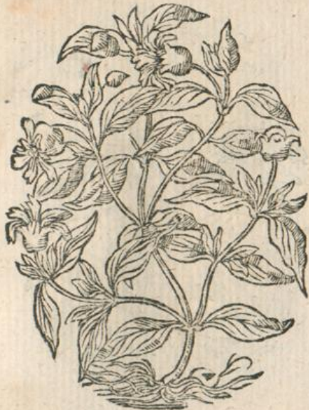
1211. Viscum , Mistel Lon.

* 1209. Alfina repens Clus.* * 1210. Alfina corniculata Clus.*