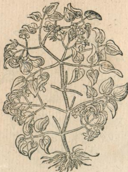
910. Vitis sylv Waldrebe. M.