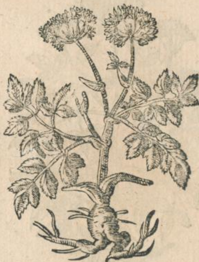
994. Angelica magna Turnb.