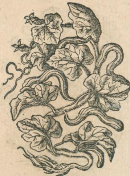
917. Lange Gurken M.