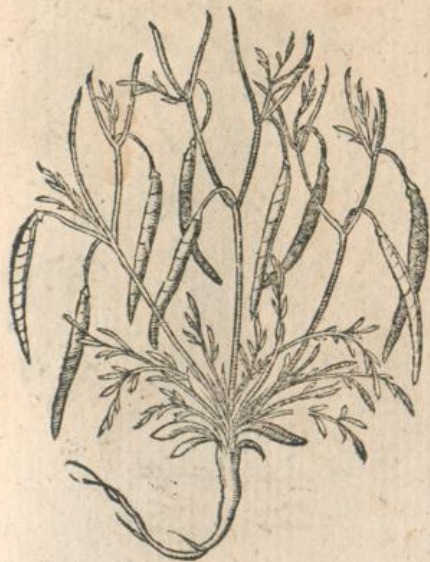
969. Cuminum siliquosum 2. Ad. L.