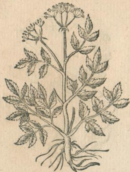
989. Sison f. Pseudopetroselinum, L.