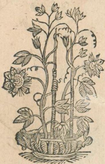
903. Hedera terrestris.

* 901. Hedera Indica, Granadilla. * * 902. Flos Granad s Passionis *