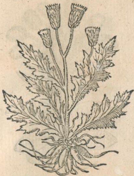
931. Cinara f. Arichochia . M.

* 929. Carduus bulbosus . Ad. L. * 930. Card. Mariæ f. lacteus .