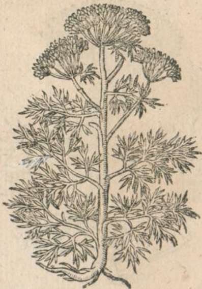
970. Ferula Narthex.