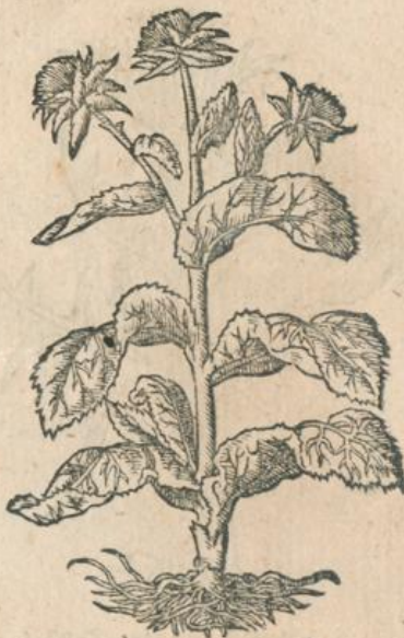
932. wilde Erdschocken.