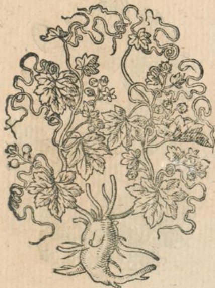
909. Bryonia, Baumrübe. T.