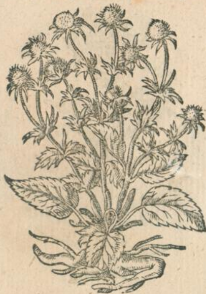
957. Eryngium planum. M.