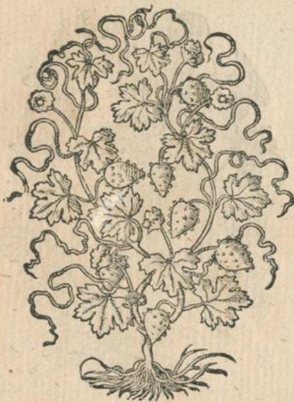
911. Momordica, Balsam-Apfel. T.