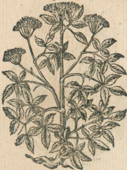
997. Ligusticum alt. Matt.