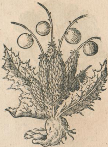
923. Cnicus, Wilder Saffran. M. 924. Cnicus fl. caeruleus, Ob. L.