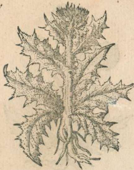
941. Acanthium Matt.