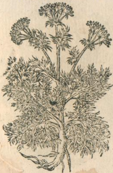
971. Ferula Libanotis.