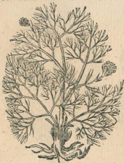
991. Caulalis, Thymoleon, Turnb.