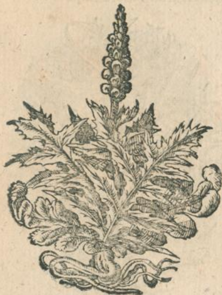
943. Acanthus Mattb.