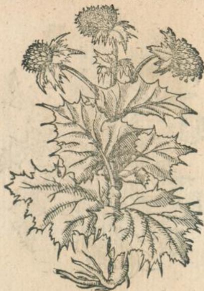
959. Eryngium pumilum. Clus. 960. Eryng. planum Mutoni. Ob. L.