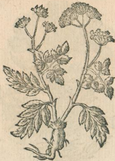
942. Branca ursina , Bärenflau . T.