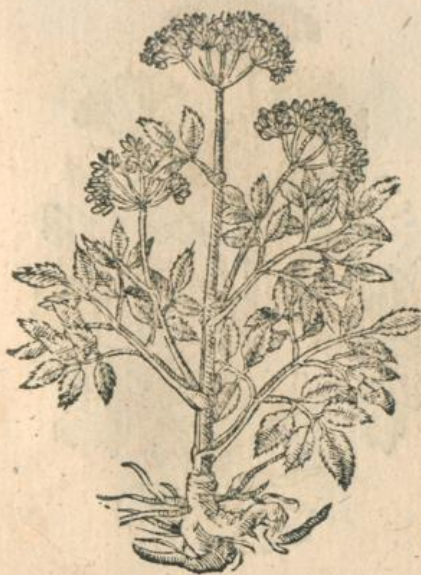
995. Angelica, Wurstwurß. Turnb.