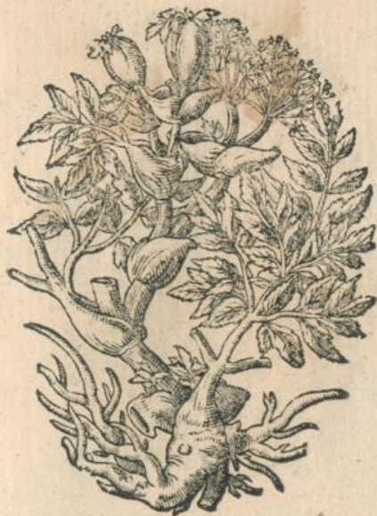
*993. Archangelica Dod.