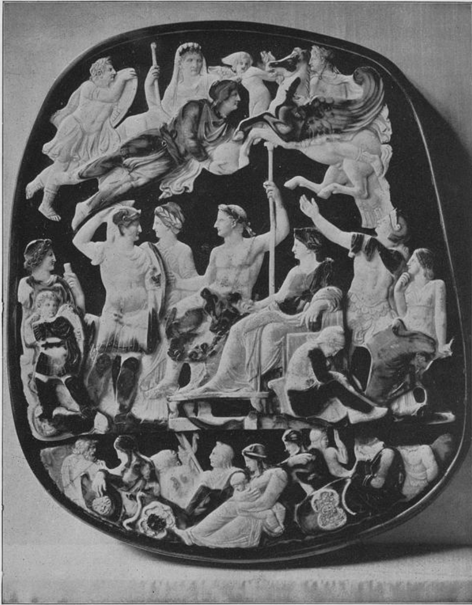
Liberius-Kameo in Paris.