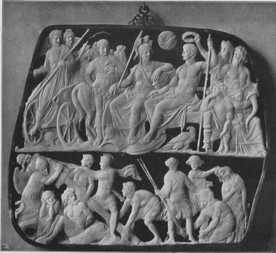
Gemma Augustea in Wien.