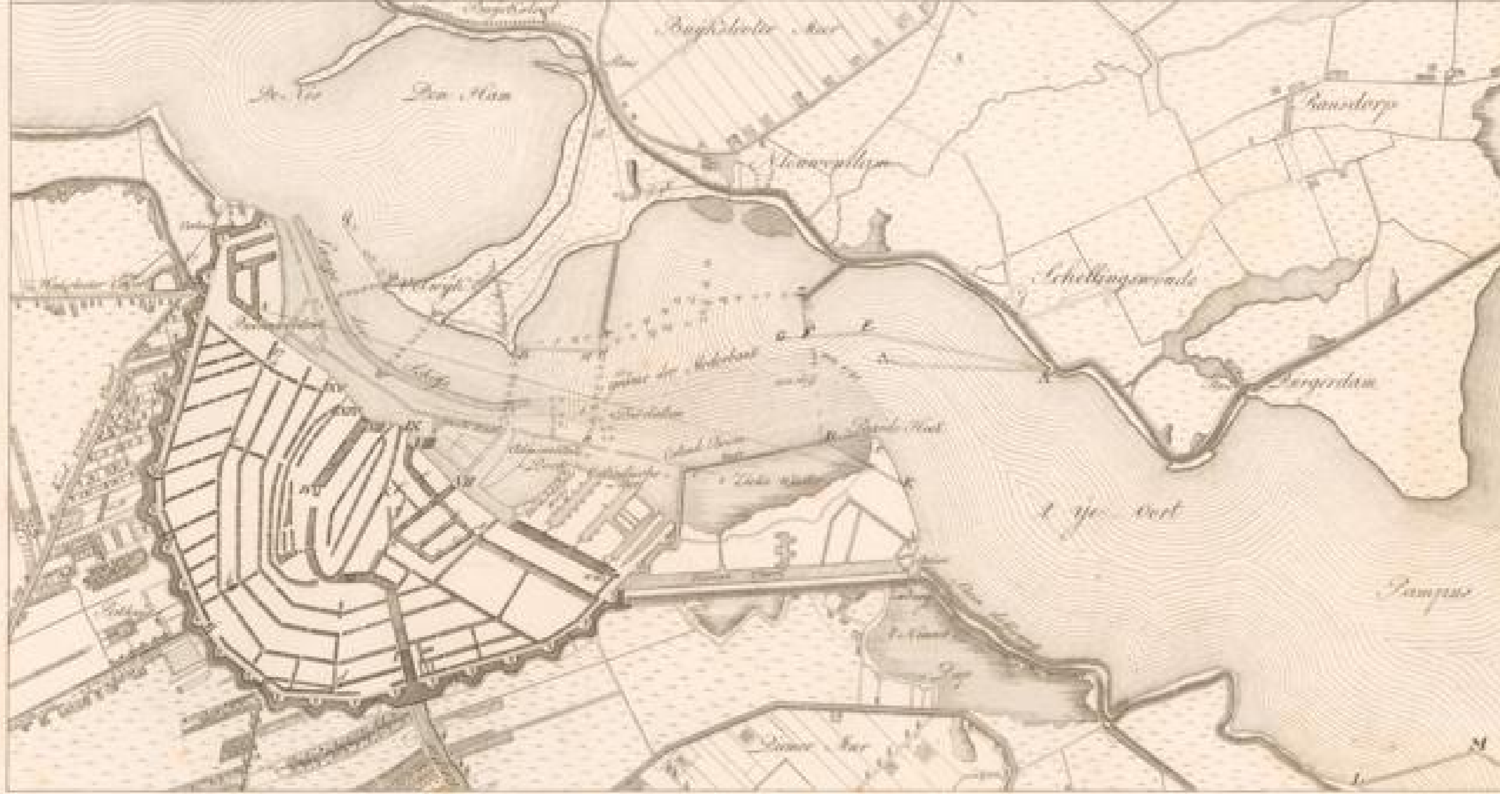
Der ij. Strom vor Amsterdam und der hydrographische Grundriß dieser Stadt.