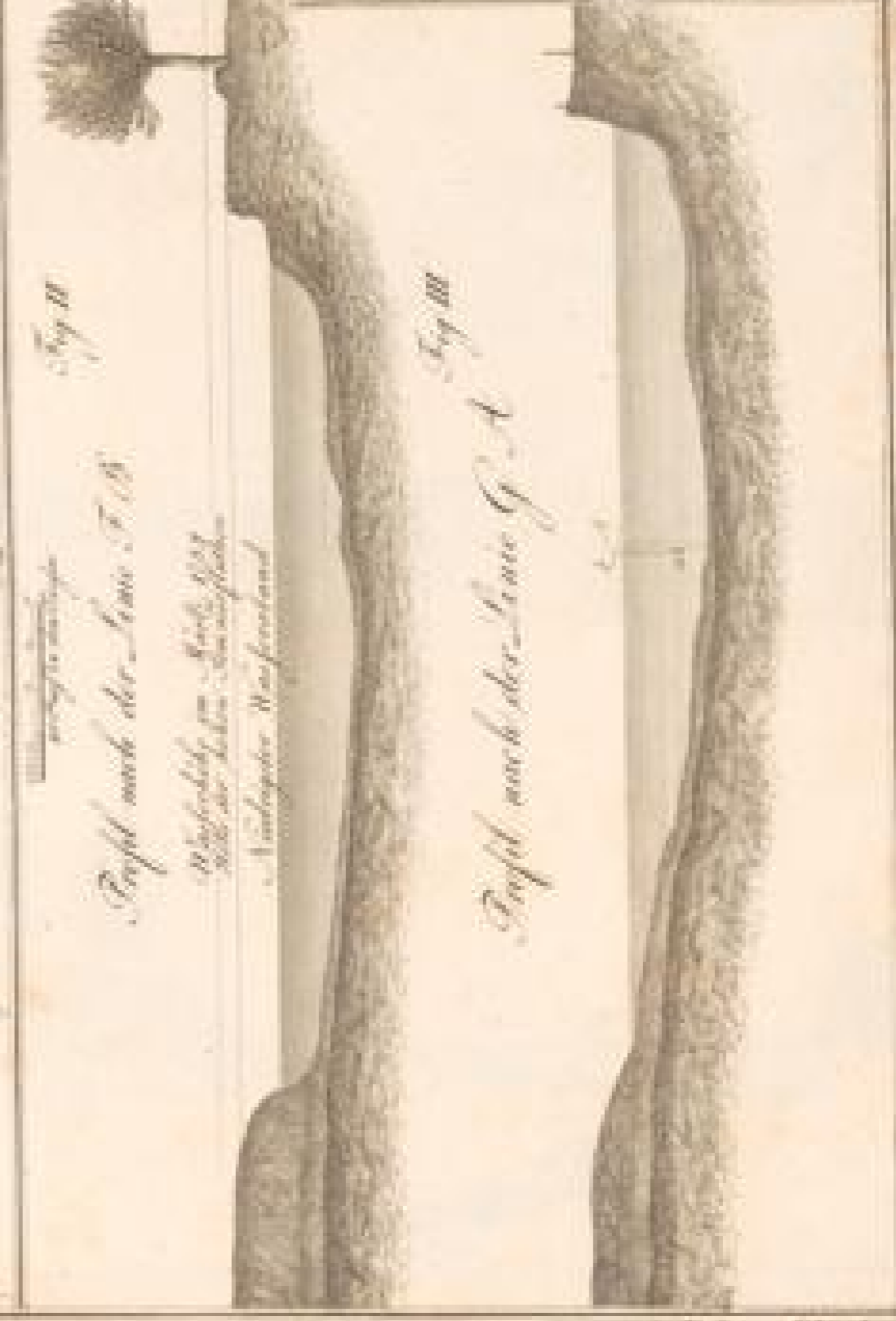
Profil nach der Linie T. A.