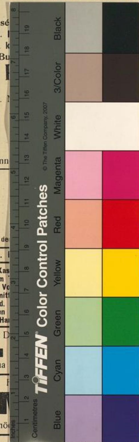
© The Tiffen Company, 2007 Hochdruckerei Ohligschläger, Düsseldorf, Volmerswertherstr. 21a.