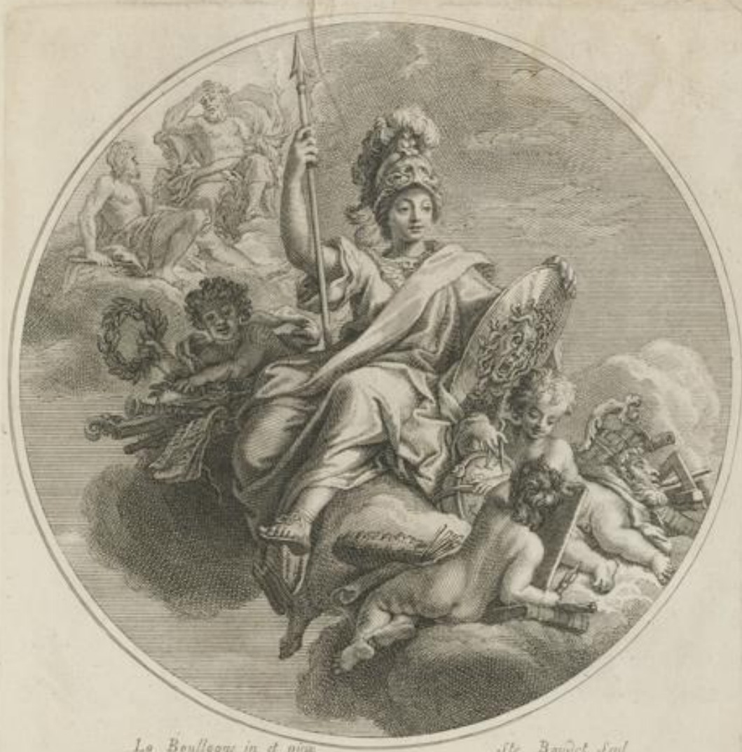
La Boullague in et pira