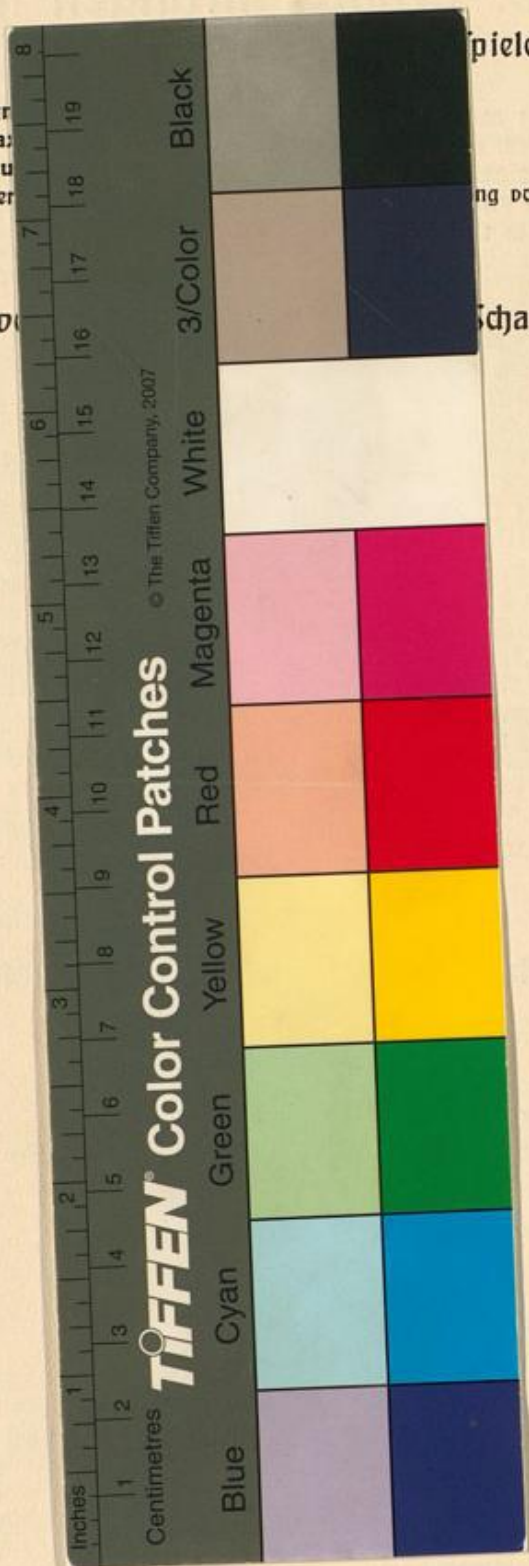
Fig Ma: Pau Ober