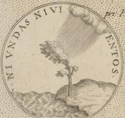
Alphonsus III. Rex Portugaliae.