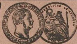
Königl. Preussische Staatsmedaille.

Maßanfertigung in bekannt tadelloser Ausführung in eigenen Werkstätten.