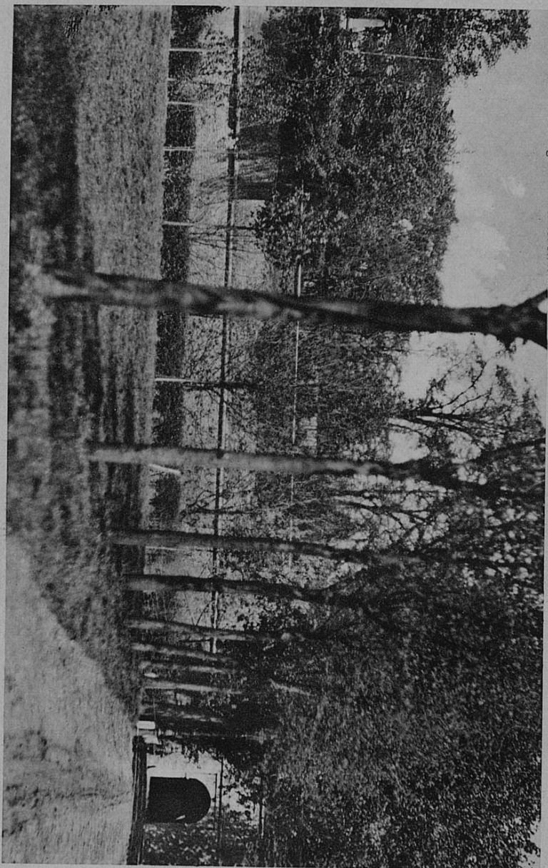
Eingang zur Zitadelle.