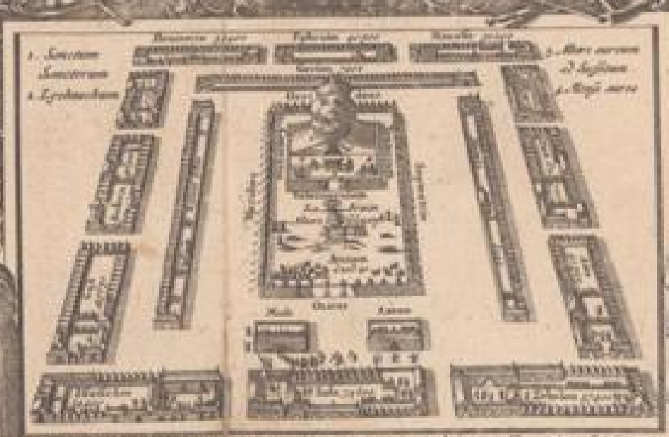
Ceterum populi de quibus hic tractatur sunt deinde de ordine notantur per desertum de Syria versus Iordanem promissionis. Canaan hic intelligitur de Iordanem. Cui accedens Iordanem a ripa orientali usque ad ripam occidentalem. Cuius occidentalis ripa vocatur: nec non et Iordanem de ripa orientali usque ad ripam occidentalem.

In hac Cartis notantur In Aquis regibus In Aquis notantur In Aquis in Pop Locus ad quem accedunt a partibus a. et b. signantur alia a. mare a. mare a. partibus de hoc sic sic signantur.