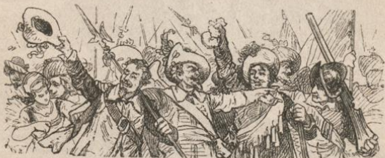
Aus Schiller's Wallenstein. Von W. Friedrich.