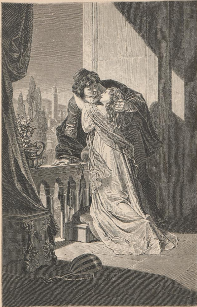
Romeo und Julia. III. Aufzug, 5. Scene. Von Ferd. Piloty.