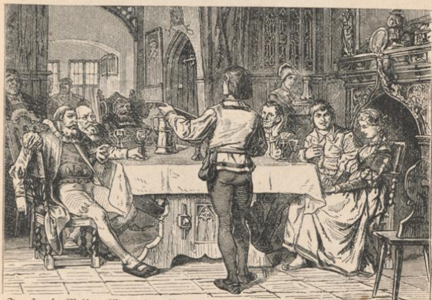
Im Hause Meister Martin's. Von E. Köhling. (Hoffmann, Meister Martin und seine Gesellen.)

— Gedichte. Mit Illustrationen nach Brindmann, Roth- bart, Thumann u. A. Fünfte Auflage. Eleg. geb. mit Goldschnitt 4 M.