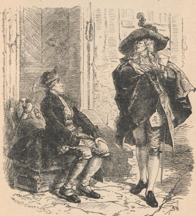
Aus Lessing's Lustspielen. Der Schatz, 2. Scene. Von Josef Watter. — Emilia Galotti. Mit Zeichnungen von Ludw. Pietsch. Eleg. geb. 2 M. , geb. mit Goldschnitt 2,50 M.

Lessing's Meisterdramen (Emilia Galotti, Minna von Barnhelm, Nathan der Weise). Mit Illustrat. von C. Hoff, L. Pietsch u. A. In 1 Band eleg. geb. 4 M. , geb. mit Goldschnitt 4,50 M. , in engl. Einband mit Gold- und Schwarzdruck 5 M.