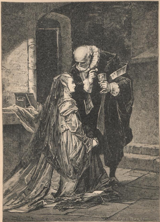
Maria Stuart's letzte Augenblide. (V. Aufzug, 7. Scene.) Von H. Diezen-Mayer.