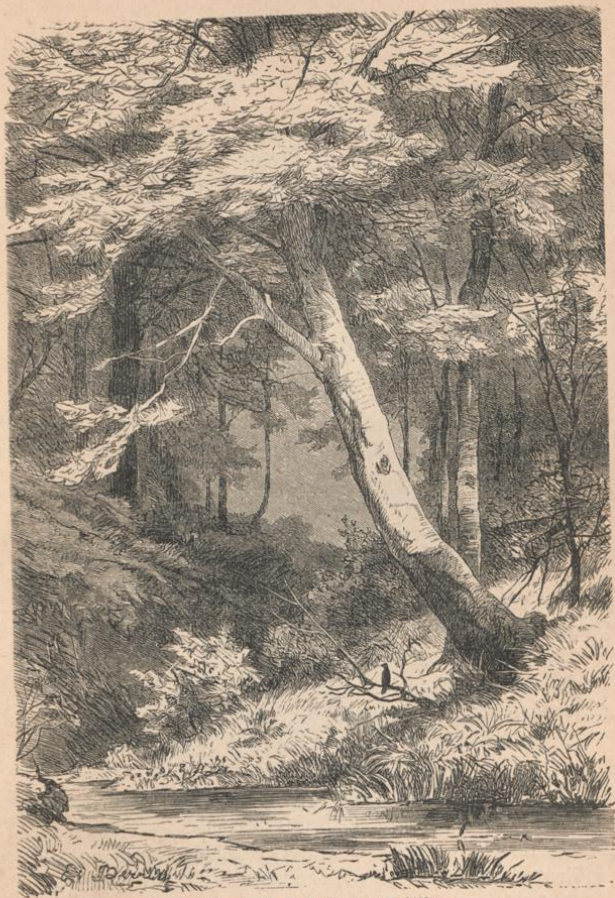
Waldbach. Aus Bodenstedt's Album.