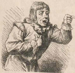
Holzappel. (Viel Lärmen um Nichts.)