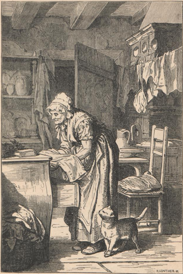
Die alte Waschfrau. Von P. Thumann. (Chamisso's Gedichte.)