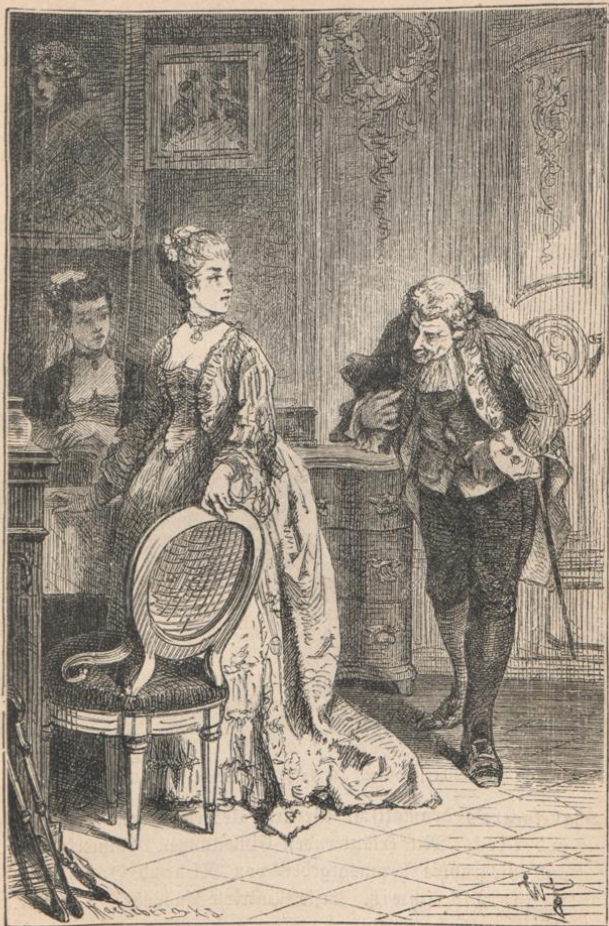
Minna von Barnhelm. IV. Aufzug, 2. Scene. Von W. Friedrich.