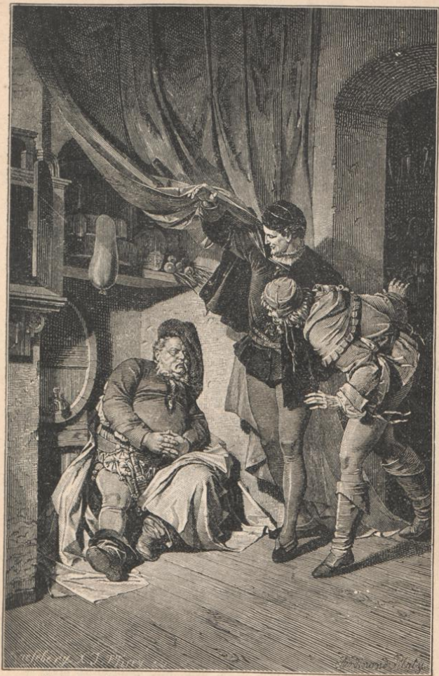
König Heinrich IV. II. Aufzug, 4. Scene. Von Ferd. Piloty.