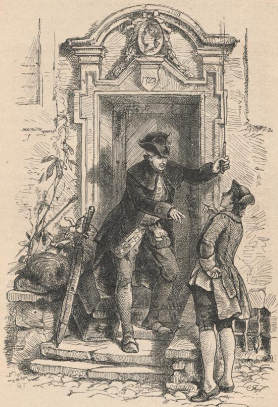
Leijng's Schatz, 9. Auftr. Von Josef Watter.