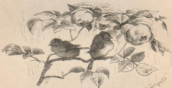
Schlecht' Wetter! (Aus Bodenstedt's Album.)

— Gedichtsammlung für Schule und Haus. Zweite verbesserte Auflage. Elegant gebunden 4 M.