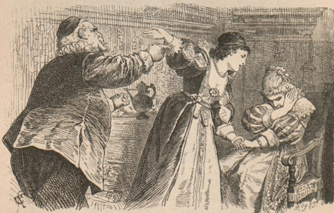
Die berühmte Widerspenstige. II. Aufzug, 1. Scene. Von E. Klimsch.

Schiller's Werke. Erste illustrierte Ausgabe, mit Einleitungen von G. Wendt. Fünfte Auflage. 12 Bände. 8. In 6 Bände eleg. geb. 20 M. , gebunden in roth Calico mit Schwarz- und Golddruck 25 M.