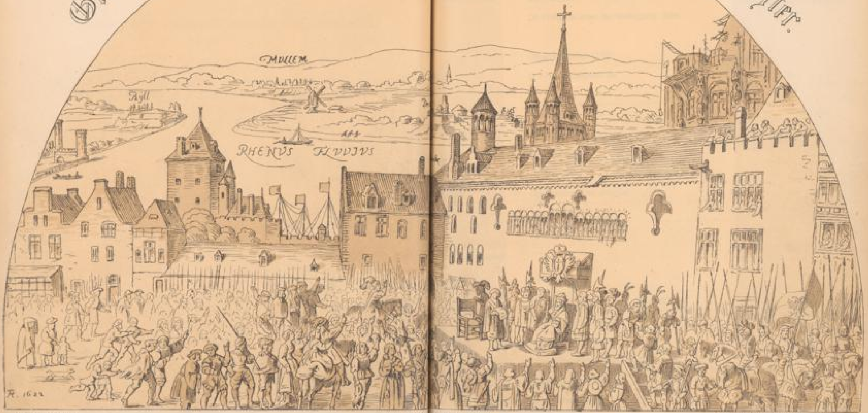
Erzbischöflicher Pallast zu Cöln, erbauet von Erzbischof Reinald von Dassel 1160-67.