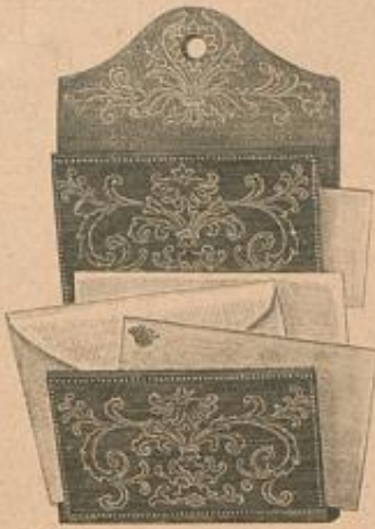
Behälter für Notizen, Anzeigen, u. s. w. Gravir-Arbeit mit Gold bemalt.