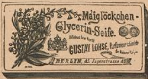
3 Stück M. 1.25.