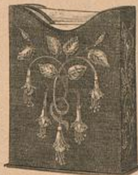
Behälter für Postkarten, samt demaltes Gravir-Arbeit.