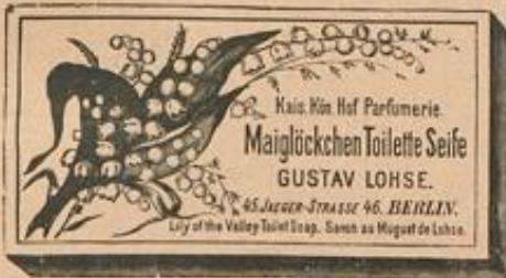
3 Stück M. 3.50.