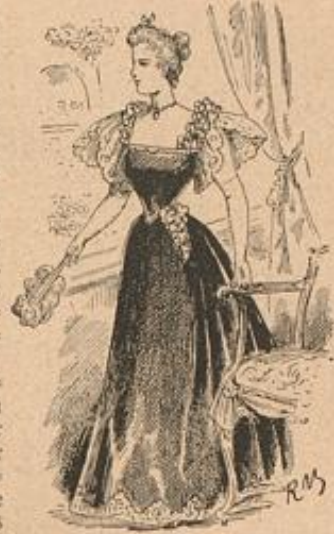
Diner- oder Theater-Toilette.

Die interessante Technik stellt zwar keine geringen Ansprüche an Geduld und Ausdauer des Arbeitenden, aber die sorgsame Arbeit findet in künstlerischer Wirkung ihren vollen Lohn. Zu den Gegenständen, die einen beliebigen Zimmerschmuck ergeben, gehört auch das Wandbrett, und hier ist der Verzierung im Lederchnitt Arbeit die prächtigste Gelegenheit geboten. In der breiten dunklen Holzumrahmung wirkt besonders