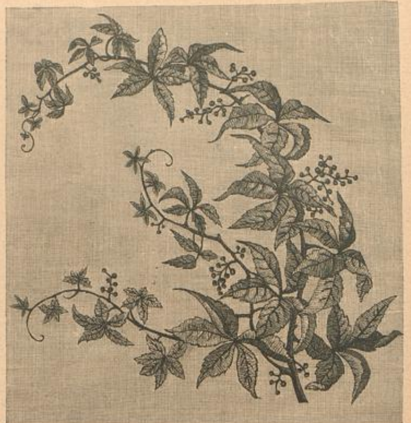
Borlage für eine Wanddecke. Blumenstickerei auf farbigen Velinen.