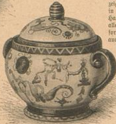
Terrine mit Deckel. Majolica-Malerei.

Eine Technik, so recht für Frauenhände geschaffen, ist die Majolica-Malerei, indem sie sich fast ausschließlich in den Dienst des Hauses stellt, bereit Decorations- wie Gebrauchsgegenstände auf mannig-