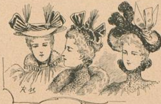
Gut für junge Mädchen. Capote-Hut. Runder Filzhut.

Paris. — Allmählig beginnt es in den Schlössern und auf den vornehmen Landhöfen wieder still zu werden. Die Gäste wie die Besucher kehren in ihre häßlichen Behausungen zurück, wo die winterliche Gesellschaft in ihre Rechte tritt. — Welche, mäßig schleppende Röcke, nur mit einer schmalen Garnitur längs des unteren Saumes, dazu die decolletirte, kurzärmelige Taille, schwere Sammet- und Seidenstoffe, duftige Spitzen und strahlende Brillanten, — das ist der Charakter, den die elegante Diner- oder Theater-Toilette dieses Winters trägt. Einen großen einfachen Stil repräsentiert die für die Oper berechnete Toilette unserer Darstellung. Graublauer Spiegel-sammet erscheint am unteren Rocksaume zu einem durchbrochenen Fadenmuster aufgeschritten, durch das weißer Atlas schimmert, — ein Besatz, der wahrscheinlich ziemlich allgemein werden wird, im Augenblick aber noch die ansehnliche Eleganz bedeutet. Ein gleicher Streifen schließt den vieredigen Ausschnitt ab; an Stelle der Ärmel treten Bolants aus weißer Spitze. Originell wirkt die Äffel-Garnitur, eine sehr volle Röhre aus kleinen Schlaufen 3 cm breiten weißen Seidenbandes. — Ein ganz verschiedenes Genre repräsentiert jeder der drei Winterhüte unserer Skizze. Nur der unbedingten Jugend bestimmt, besteht der erste Hut aus einer runden flachen Grundform aus hell-