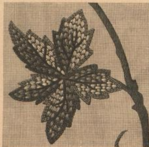
Blumenstickerei zur Wanddecke.

Darstellung eines einzelnen Blattes zeigt. Um den Wechsel der Farben in beiden Stüchlagen aus freier Hand auszuführen, bedarf es nicht allein genauer Kenntniss der Blattform mit ihrem Geäder, sondern auch großer Sicherheit im Schattiren; andernfalls thut man gut, nach einer vorher entworfenen Farbskizze zu arbeiten. Die feinen Contour-Linien sind später mit der Tambour-Nadel auszuführen; Stielstich-Linien markiren die Blattadern; an dem bronzebraunen Stiel, wie an den fahlblauen, mit hellen Reflexlichtern versehenen Beeren gelangt