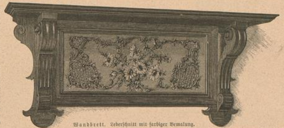
Wandbrett. Lederchnitt mit farbiger Bemalung.

Die interessante Technik stellt zwar keine geringen Ansprüche an Geduld und Ausdauer des Arbeitenden, aber die sorgsame Arbeit findet in künstlerischer Wirkung ihren vollen Lohn. Zu den Gegenständen, die einen beliebigen Zimmerschmuck ergeben, gehört auch das Wandbrett, und hier ist der Verzierung im Lederchnitt Arbeit die prächtigste Gelegenheit geboten. In der breiten dunklen Holzumrahmung wirkt besonders