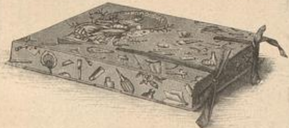
Raketen für Arbeiten in Marmorquaj.

Aquarell-Farbe bemalt werden kann. Weniger mit dem Pinsel vertraute Hände beschränken sich dabei auf eine leise Färbung mit Sepia oder Asphaltpigment, die bei den Körpertheilen nur die Tiefen des Gesichtes etwas berührt, das Haar kräftiger deckt und das Gewand besonders in den Falten deutlich markirt. Größere künstlerische Ausbildung und geschultes Farbensensibilität setzt die verschiedenfarbige Bemalung voraus. Hier geben die reizvollen antiken Tanagra-Figürchen, die mit der matten gleichmäßigen Färbung der großen Gewand-, Haar-