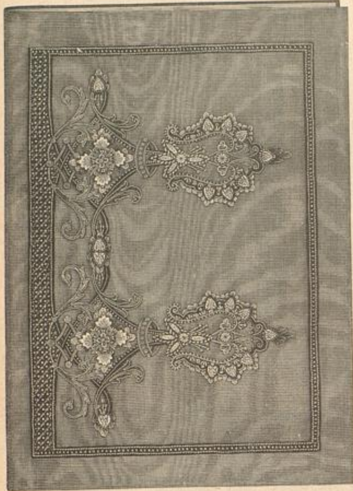
Schreibmappe. Stickerei mit Email-Auflagen.

Häufigster der Stoff-Verzierungen giebt die kleine Ueberficht genügenden Anhalt.