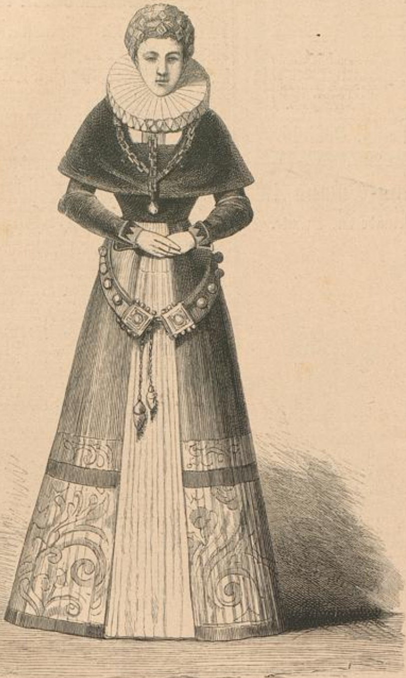
Stettiner Brautjungfer. 1601.

Blätter für Kostümkunde. Neue Folge. 221. Blatt.