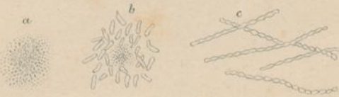
Vibrio. (a. et b. Lineola , c. Bacillus )