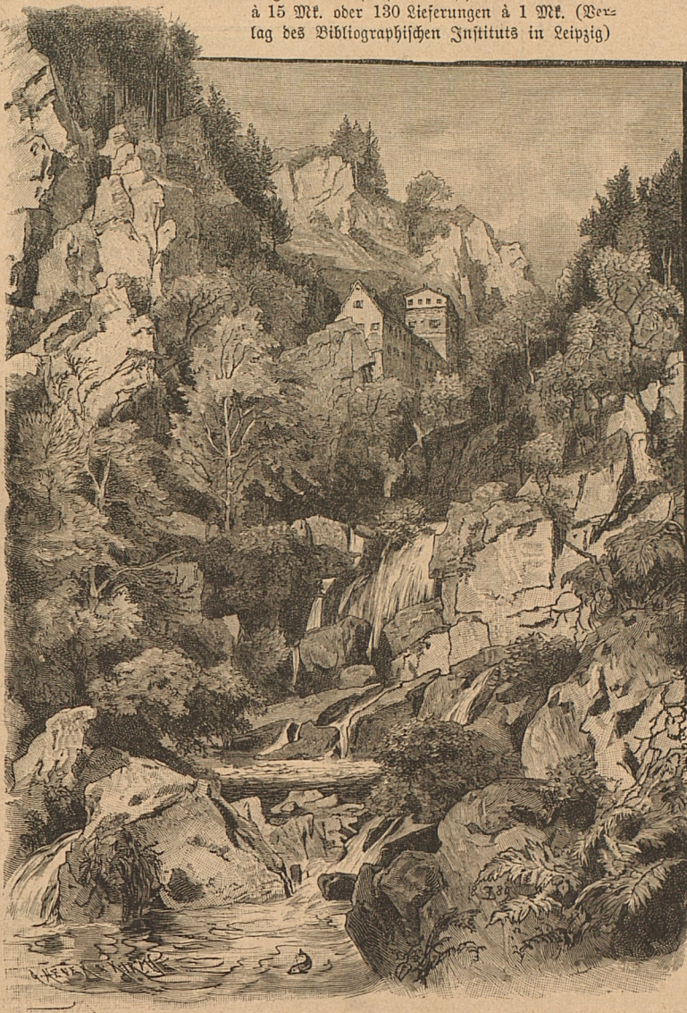
Wolfschlucht bei Güttenbach.