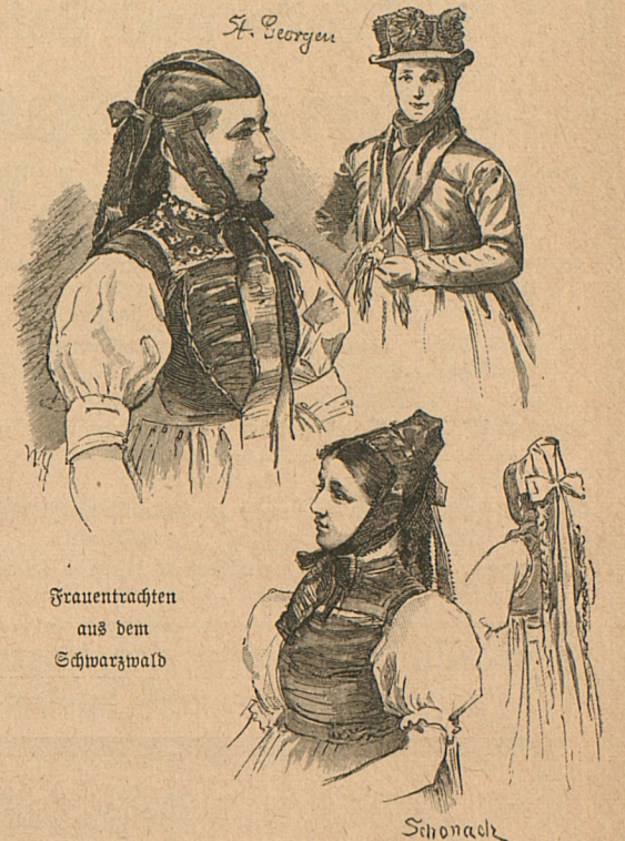
Frauentrachten aus dem Schwarzwald