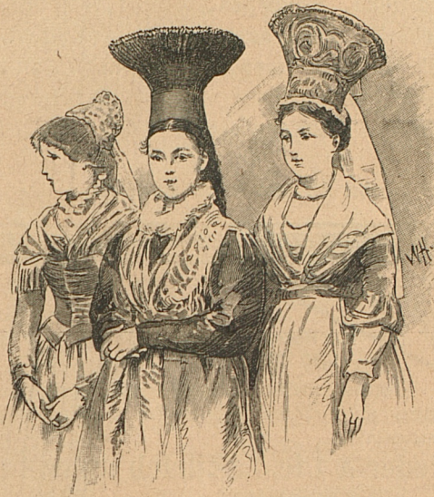
Alte Billinger Trachten