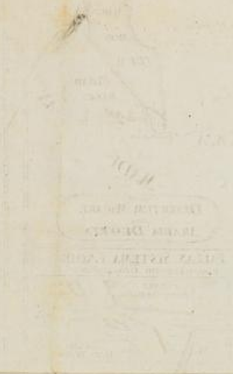
PLATE 1 MUSEUM OF THE SMITHSONIAN INSTITUTION WASHINGTON, D. C.