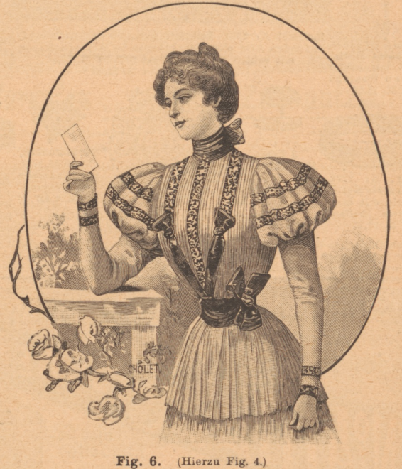
Fig. 6. (Hierzu Fig. 4.)

Für den Anzeigenteil verantwortlich: Georg Grabert in Berlin.