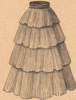
Fig. 4. Rock zu Fig. 6.

Für die Toilette in Fig. 6 ist roter Linon gewählt und der Rock, wie Fig. 4 zeigt, mit vier breiten, übereinanderfallenden Plisséfrisuren bedeckt. Die plissierte, in Blusenform gearbeitete Taille hat vorn und hinten vertikale Spitzeneinsätze, die auf schwarzem Band ruhen. Gürtel und Stehfragen sind aus schwarzer, faltiger Seide gebildet, und der erstere schließt seitlich, der letztere hinten mit einer Schleife. Vom Gürtel aus ziehen sich bis zu den auf der Brust endenden seitlichen Einsätzen der Vordertaille schwarze Seidenbänder, die mit je einer Schlinge und einem Knoten enden. Die Ärmel sind am Handgelenk und an den kurzen Puffen je zweimal mit Spitzeneinsatz garniert.