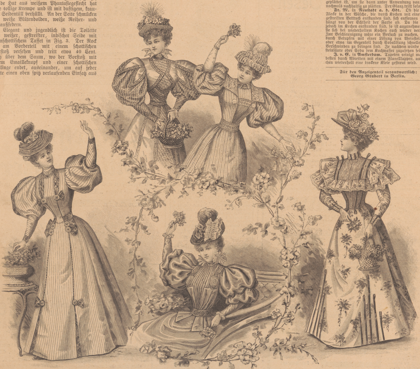
Fig. 1-5. Toiletten für Blumenkorsos etc.

Für den Anzeigenteil verantwortlich: Georg Grabert in Berlin.