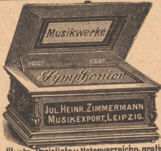
Illust. Preisliste u. Notenverzeichn. gratis

General-Vertreter für Deutschland: LEVINGER & FEIBEL , FRANKFURT a/M