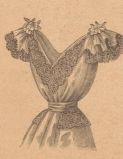
Rückansicht zu Nr. 34.