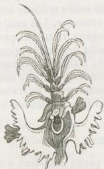
Fig. 981. — Balane telline (l'animal grossi sorti de son test).

Les cirripèdes forment la cinquième classe des annelés articulés qui comprennent les balanes ( fig. 981 ) et les anatifes ( fig. 982 ).