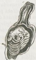
Fig. 982. — Anatife lisse (coupe verticale montrant l'animal).