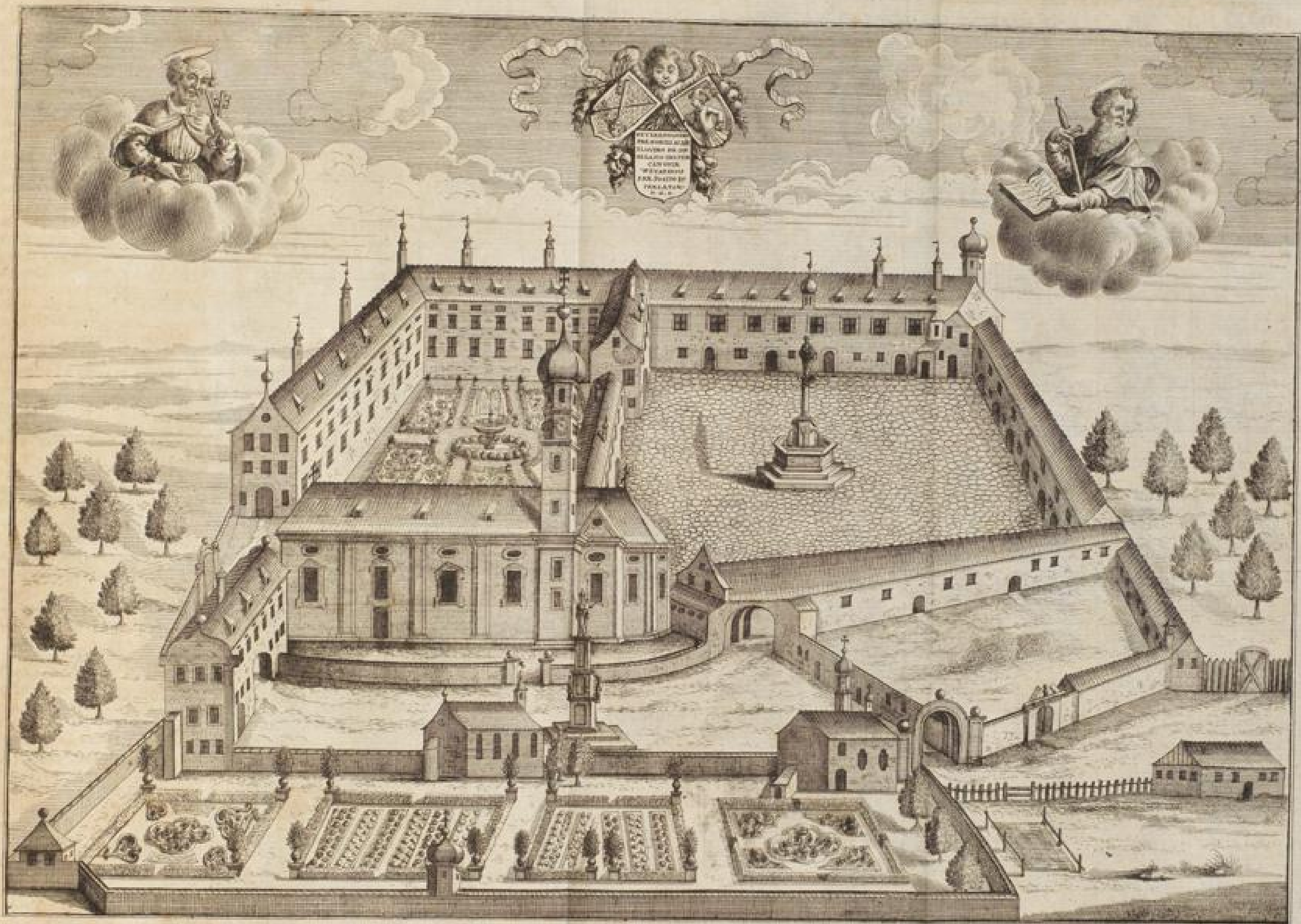
CANONIA REGULARIS WEYARENSIS CANN: REGG ORD. S. AUGUSTINI DIOECESIS ERISINGENSIS IN BAVARIA IN HONOREM PRINCIPUM APOSTOLORUM SS PETRI ET PAULI FUNDATA ET CONSECRATA ANNO CHRISTI. M. CXXXIII