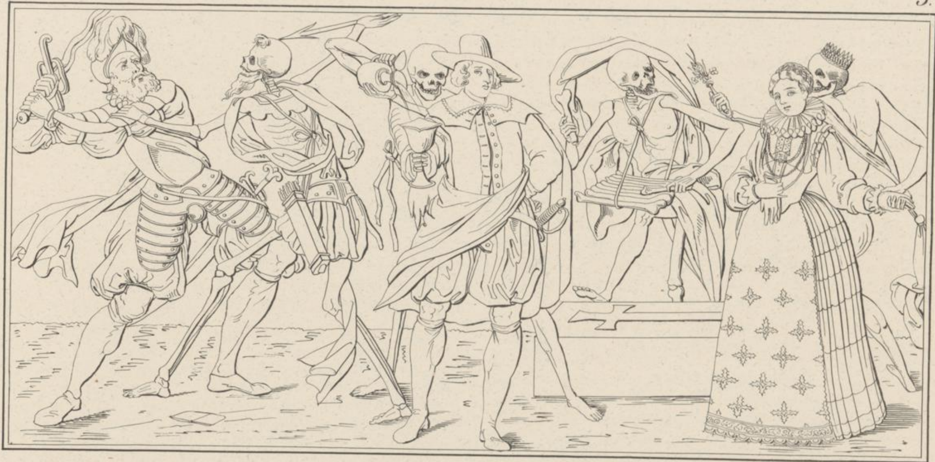
Lith. v. Gehr. Englin in Luzern.