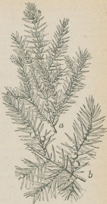
4. Echter Wacholder, Juniperus communis . a) ♂ Zweig mit Blüten, verkl.; b) ♀ Zweig mit Früchten, verkl.

Als seltene Abnormi- tät kommen Zwitterblüten vor, indem sich an den Hochblättern der weib-