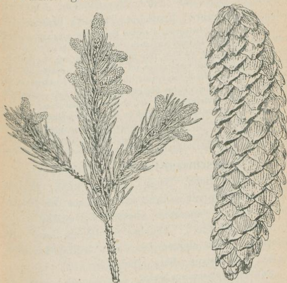
2. Echte Fichte, Picea excelsa . ♂ Blütenzweig und Frucht, verkl.

3—50 m hoch. Rinde oft rotbraun. Junge Zweige kahl oder etwas kurzhaarig, selten stärker behaart. Blätter grün oder blaugrün, ziemlich gleichseitig