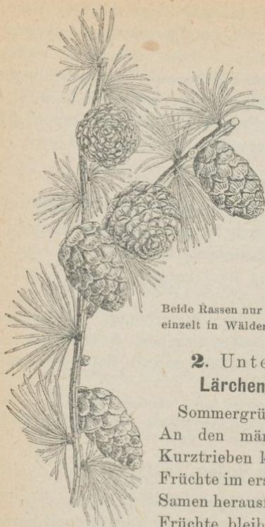
1. Gemeine Lärche, Larix decidua . Fruchtzweig, verkl.

eingedrückter Spitze. 10. ( Pinus cedrus , Cedrus libanotica ).