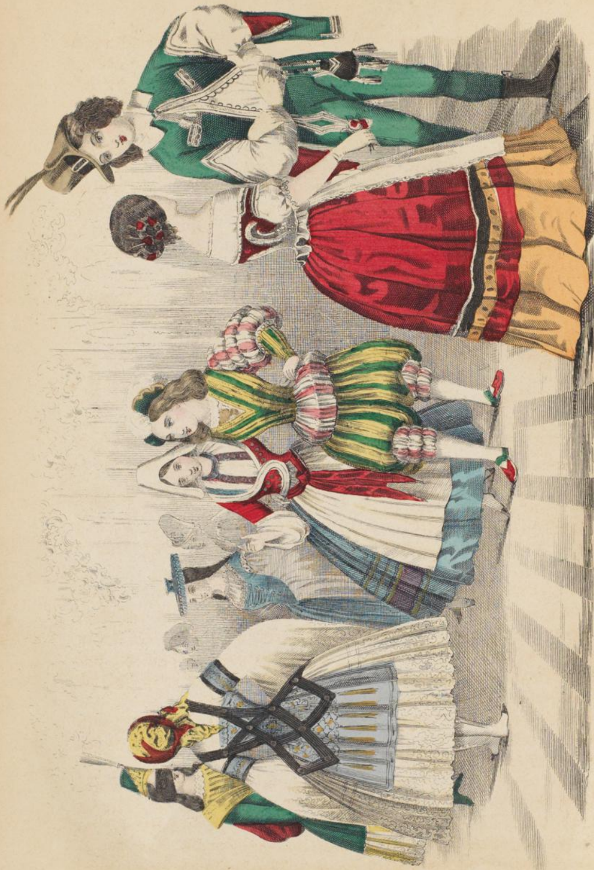
1. Januar 1849.

Man für weißt diejen nicht meist nicht mehr so gar so sehr. Die für ad L. in in die englischen wird häufiger. E und Lamentable mit haben sich an man die vornehm die großen Einrich die besten in die beiden gel in die Stadt Satz die in ge Cach bei in