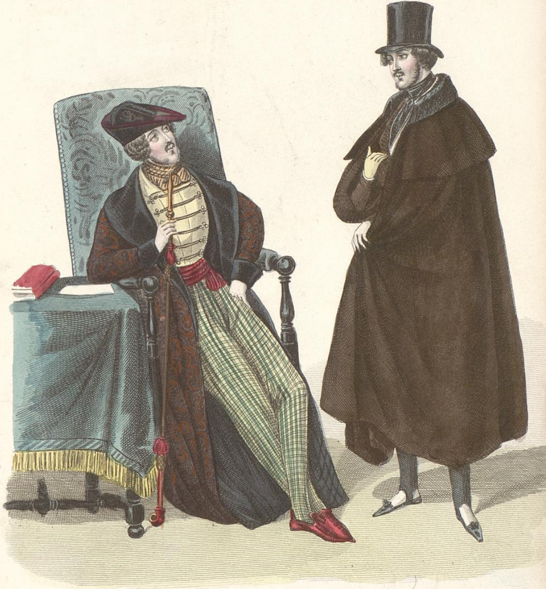
Costumes Parisiens Journal des Dames et des Modes Costumes des Ateliers de M. r Hamann 83 r ue des Petits Champs On s'abonne Rue du Helder 44 (Ch. ois d'Antin)