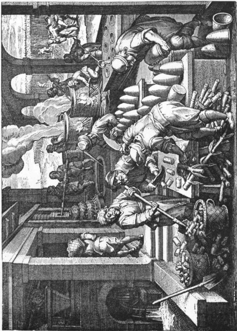
Zuckerfabrikation in Sicilien um 1570, nach der Bildersammlung „Nova reperta“ des Joann. Stradanus.