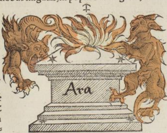
i tu, exo

A ra antarticum circulum prope tangens inter hoſtiæ caput & ſcorpionis caudā extremam collocat, occidēs arietis exort