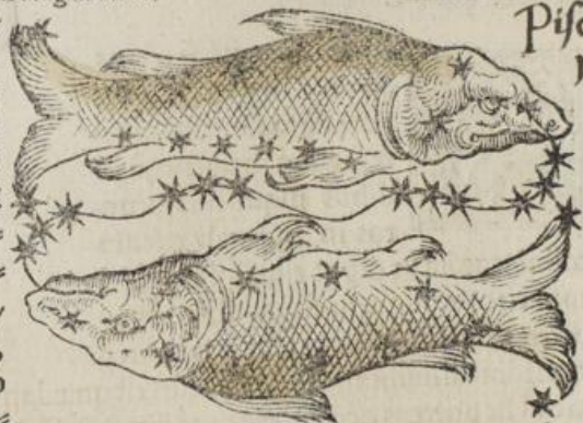
Pisces, sig. 12.

Orū alter Notius, Boræus alter appellatur, ideo quod unus eorum qui Boræus dicitur inter æquinoctiales & æstiuū circulū sub Andromedae brachio collocatus, & arcticū polium spectans constituitur, alter autē in zodiaci circulo extremo sub scapulis equi, non longe ab æquinoctiali circulo collocatus, spectans ad occasum. Hi pisces qui-