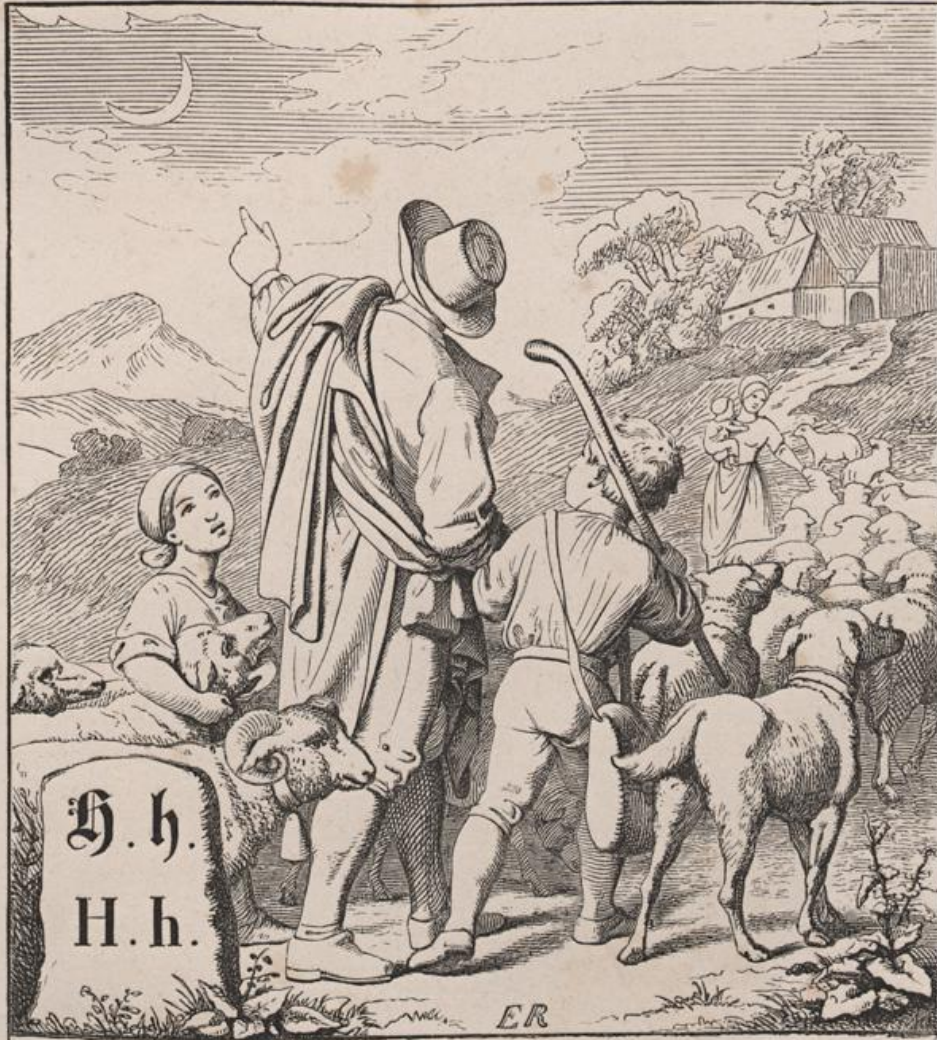
H. h. H. h. ER Girl und Herde