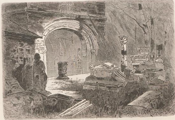
Mainz. Hof des Germanischen Museums.

hingestreut in das weinduftende kleine Eden, in welchem es der liebe Gott so unendlich gut mit den Menschen gemeint, daß er dicht neben der Rebe die Selters-Quelle dem Boden entspringen ließ.