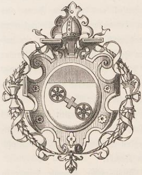
Wappen von Mainz.

Trete jetzt mit mir ein, Leser, durch das eigentliche Thor von „des deutschen Reichs Pfaffengasse“, durch Mainz, das „goldne“. Ich führe dich bis nach Köln, dem „heiligen“, durch die schönsten Ufer, mit welchen Gott den mächtigsten der deutschen Ströme gesegnet.