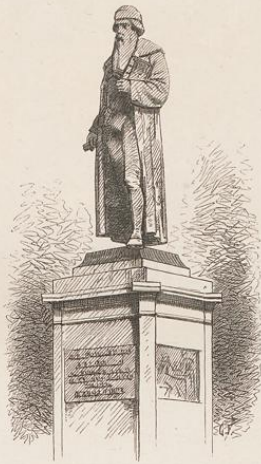
Gutenbergdenkmal in Mainz.

hinein gezwängte Eisenbahn, deren Kohlen- und Wagenschuppen, deren Qualm und Lärm hinter einem geschwärzten Geländer das Ufer verdüstern. Den ganzen Tag ruft uns hier die Abfahrtsglocke der Eisenbahn, das Geläute der Dampfer zu, daß gar keine Zeit mehr zu versäumen. — Das Hin- und Herandrehen der Maschinen, das Rangiren der Wagen läßt dem Reisenden immer nur einige glückliche Momente, über die Schienenstränge hinweg die Landebrücken zu erreichen. Benutzen wir einen dieser Augenblicke, um den kleinen „Adolf“ zu besteigen, den Lokal-Dampfer, der uns, Millionen glitzernde Diamanten aus dem Rhein herauf schaufelnd, zwischen den grünen, in den Fluß hingewürfelten Inseln nach Biebrich, hinüber zum Nassauer Land, einer der schönsten Perlen im deutschen Reiche, trägt.