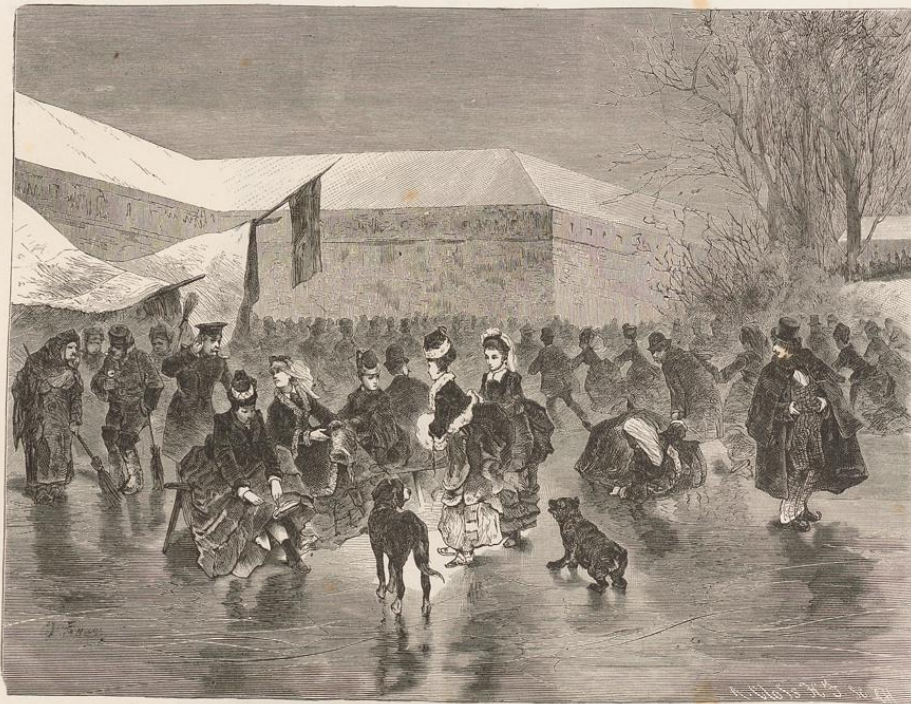
Mainz. Schlittschuhlaufen in den Festungsgräben.

Niedernebelung der Juden aus, deren Reichthum seit lange Aergerniß gab. Die Pfandhäuser in den Händen italienischer Juden (daher noch heute der Name „Lombard“) machten großartige Geschäfte, italienisch-jüdische Bankhäuser trieben ärgerlichen Luxus — daher die durch das Bischofsthum leicht provozierte Rache des Volks. Der Bischof selbst theilte sich mit den Räubern in die Beute und mußte dies durch siebenjährige Verbannung in einem Thüringer Kloster büßen.