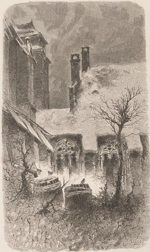
Mainz. Aengang in der Stephanskirche.

Bischofsmühe, die Klöster überschwemmen das Land. Die Kirche dominierte unter dem Schutz des Papstes. Ein Mann wie Bischof Hatto mußte durch die ihm boshaft angedichteten Gräueltaten der Welt im Mäusesturm eine der schändlichsten Uebersieferungen geben; selbst Erzbischof Willigis, der Wagner-Sohn, wohl der edelste von allen, hatte den Ehrgeiz, sich zum Kurfürsten ernennen zu lassen und nahm doch in das Stadtwappen das bekannte Rad auf, demüthig