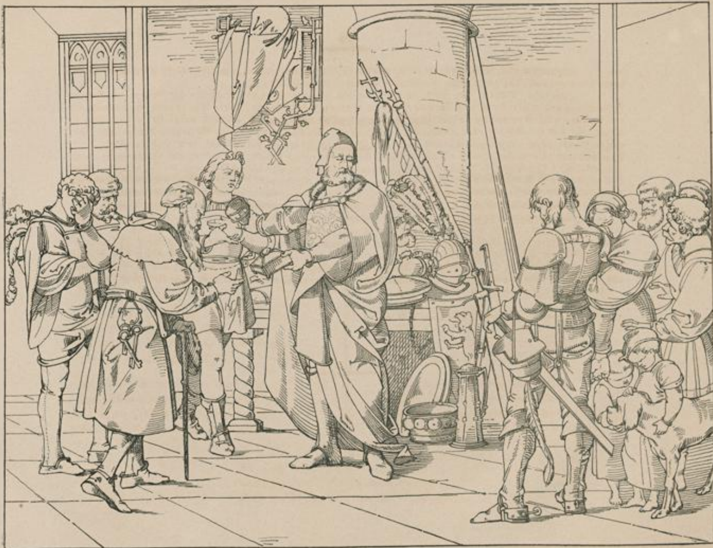
Pfalzgraf Hermann von Staleck.