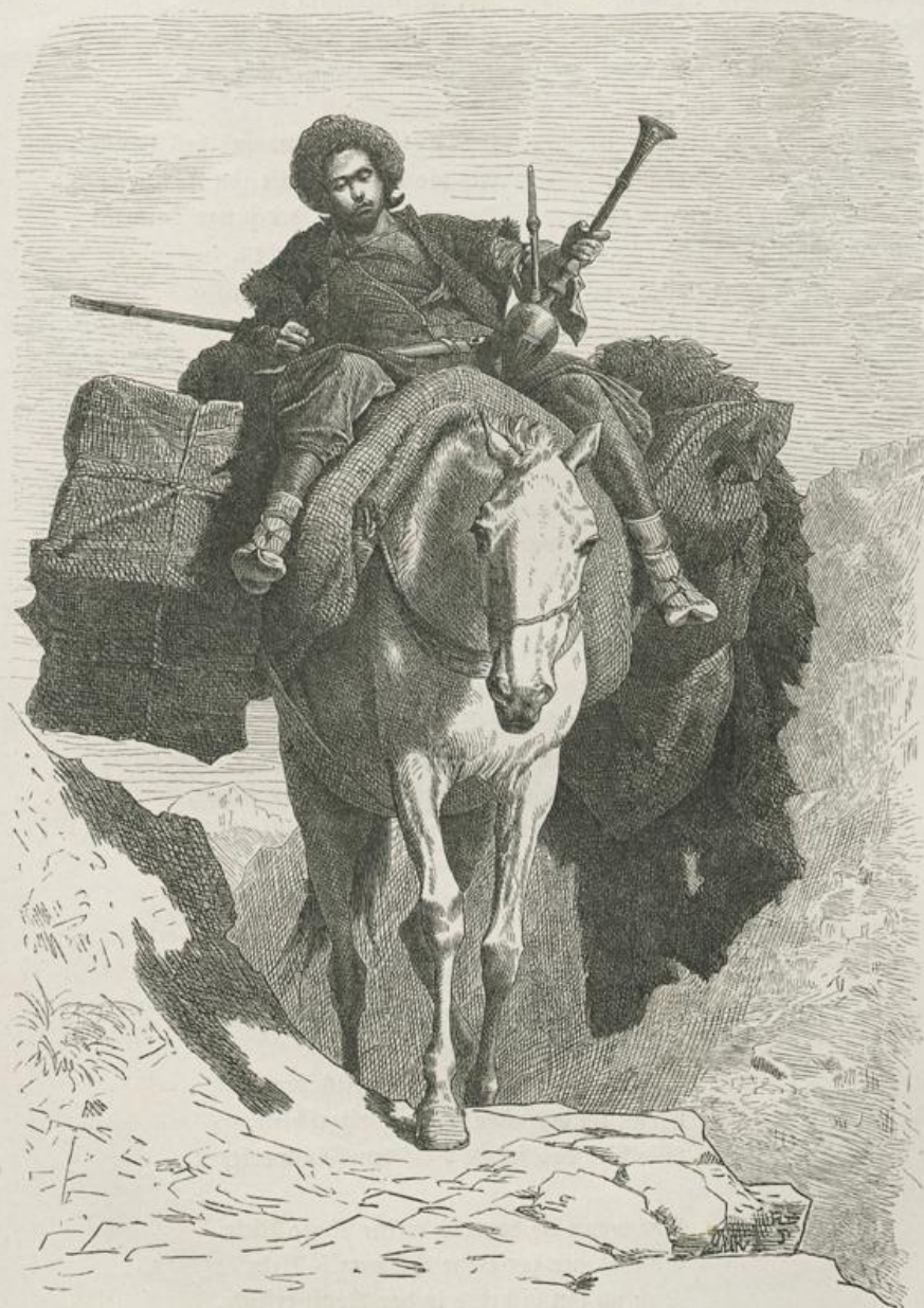
Theodor Horschelt in München.