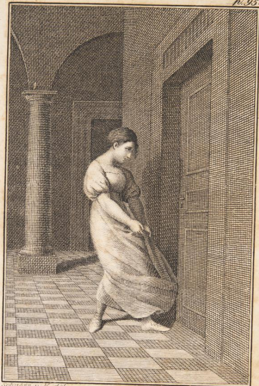
schirer v. H. del.