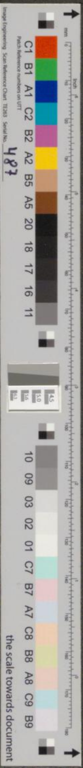
Image Engineering Scan Reference Chart IT201 Serial No. 487