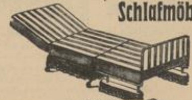
Als bequemem Bett.