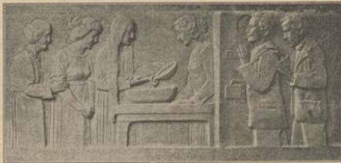
Relief an dem Denkmal für August Becker.