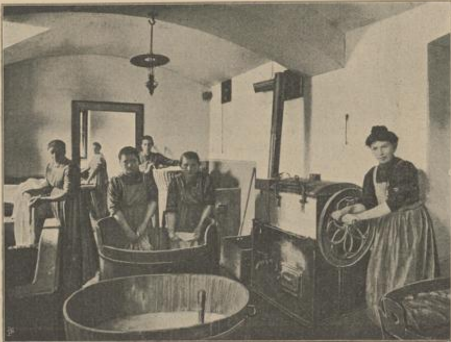
Landwirtschaftliche Schule für Mädchen in Grabnerhof: In der Waschküche.

In Krankheitszeiten kann die Hausfrau in der Stadt durch den Arzt und geeignete Pflegerinnen unterstützt werden, auf dem Lande dagegen ist dies selten