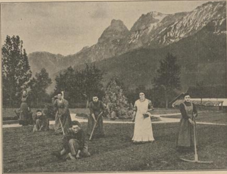
Landwirtschaftliche Schule für Mädchen in Grabnerhof: Bei der Gartenarbeit.

In Grabnerhof, wo jährlich zirka 50 Mädchen ausgebildet werden, beginnt das frische, fröhliche Treiben im Hause um 1/2 5 Uhr; nachdem die Betten aufgedeckt, alle Fenster der Schlafräume geöffnet