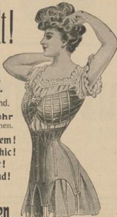
Juliette Hüftenformer K 10.—, 16.—, 21.— K 30.—, 36.— Rückenhalter K 6.—, 10.—, 16.—