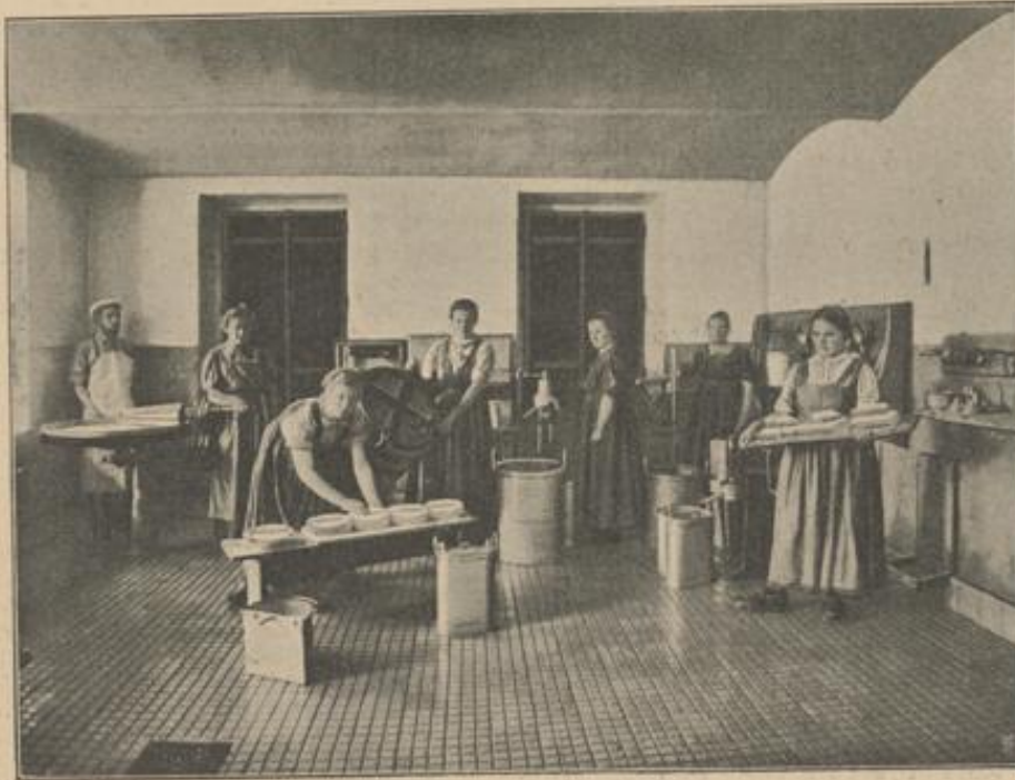
Landwirtschaftliche Schule für Mädchen in Grabnerhof: Bei der Kellereibereitung

In den praktischen Stunden wird alles durchgearbeitet, was für eine Bauersfrau wichtig ist. Es werden Kinder, Schweine, Kälber, Hirsche, Ziegen, Lämmer und Schafe verarbeitet. Die Mädchen müssen das Fleisch zerteilen, sie lernen die Stücke nach ihrer verschiedenen Güte kennen. Das Fleisch wird auf verschiedene Arten gebeizt und geräuchert, Würste werden hergestellt. Jede Woche wird einmal Schwarzbrot gebacken, und jeden Tag backen die Schülerinnen Weißbrot oder Semmeln für die Pause. Ein Tag der Woche ist für Wäsche und Bügeln bestimmt, am Samstag wird geschneuert und gepuht. Die Küche wird unter Aufsicht einer Lehrerin von den Schülerinnen selbst besorgt und es wird nur Gemüse, Fleisch etc. benötigt, das aus der Anstalt stammt. Ein großer Gemüsegarten, ein Stall mit einigen 50 Kühen, eine kleine Molkerei, der Hühner- und Schweinefall ergänzen das Feld der praktischen Tätigkeit. Obwohl die Anstalt und Landwirtschaft gegen 60 Menschen versorgt, so ist man doch bestrebt, möglichst alles selbst zu erzeugen, um