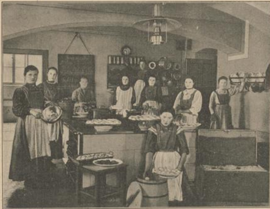
Landwirtschaftliche Schule für Mädchen in Grabnerhof: In der Küche.

Wir haben für alle Berufsarten Fachschulen, aber für unsere Bauernmädchen stehen uns nur wenige zur Verfügung. Oft findet man auch an maßgebender Stelle die Ansicht vertreten, daß die Ausbildung der Mädchen durch die Mutter genüge. Es wird allerdings immer die Hauptsache sein, daß die Tochter von ihrer Mutter in