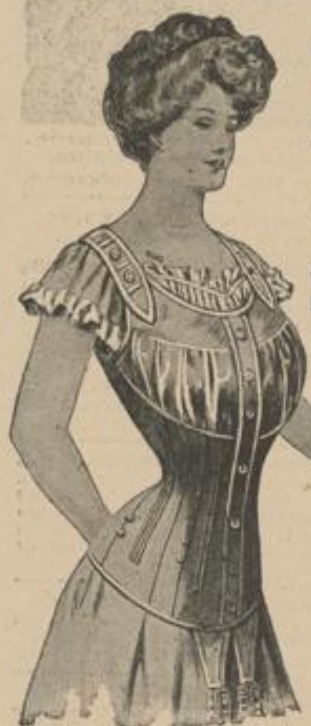
Thusnelda zu Hause waschbar, Fischbein zum herausnehmen von K 8.— bis K 12.— und K 20.—

Man verlange jedoch ausdrücklich das echte „Dr. Hommel's“ Haematogen und lasse sich keine der vielen Nachahmungen aufreden.