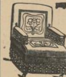
Als eleganter Fauteuil.