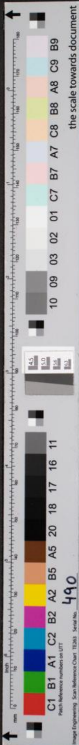
Image Engineering Scan Reference Chart TEX3 Serial No. 490