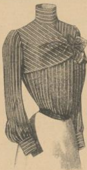
Nr. 307. Aus Prima modelarbig gestreiftem Louisa, in rosa, blau, grün, lila, fraise, weiss oder grau Kronen 22.75

empfohlen zur Frühjahrs- und Sommersaison ihr reichhaltiges Lager von Damenblousen aus Seide, Batist, Zephyr, Flanell etc. etc. in den neuesten französischen und englischen Modellen vom billigsten bis zum feinsten Genre.