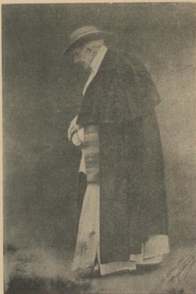
Modell No. XII. Nach der letzten Aufnahme.