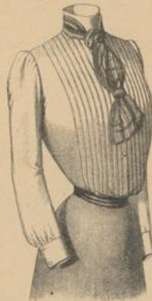
Nr. 309. Aus englischem Piqué, weiss, mit farbiger Seiden-Echarpescravate Kronen 8.—

Muster von Mode-Waschstoffen, wie Creton, Zephyr, Batist, Piqué etc. etc. auf Verlangen gratis und franco!