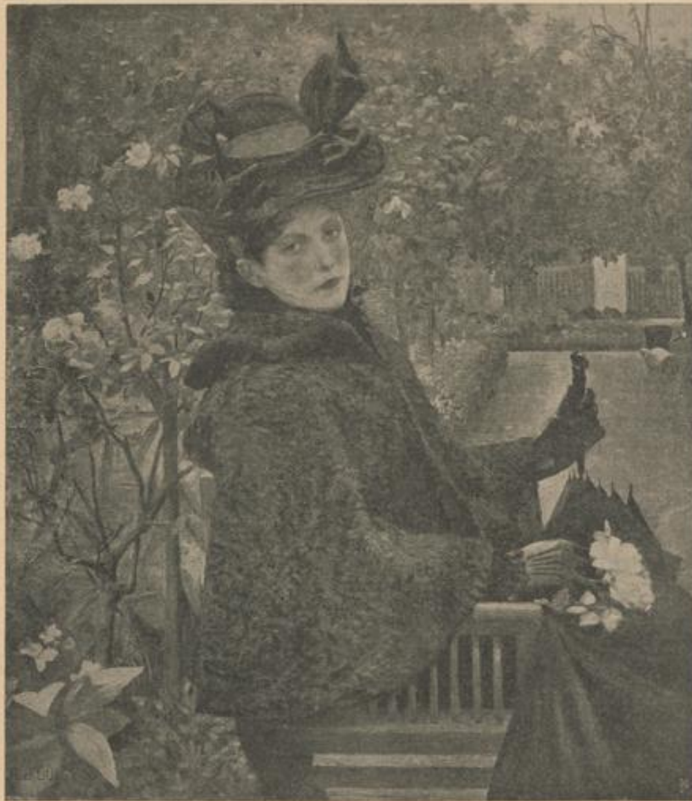
A. D. Goltz, Damenporträt.

Die Fortschritte waren derartig, daß 1771 eine neuerliche Erweiterung der Beschäftigung notwendig erschien. Nahezu 300 Arbeiter fanden damals hier ihren Unterhalt. Dennoch trat im Jahre 1783 ein unerwarteter Wendepunkt ein, als über Beschlußfassung Kaiser Josephs II., „keinen Industriezweig der Privatbetriebsamkeit zu entziehen“, am 23. October der Befehl zur Feilbietung dieser Fabrik bekannt gemacht wurde. Der Ausrufspreis war mit 385.000 Gulden bestimmt; da aber am 20. Juli 1784, dem Versteigerungstage, weder Kaufsüchtige noch Pächter sich meldeten, verordnete der Monarch unter dem 5. August 1784, die Manufaktur auch ferner auf Rechnung der Bankocasse betreiben zu lassen. Die Direction wurde dem Hofrath Konrad Freiherrn von Sörgenthal übertragen, mit