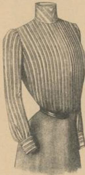
Nr. 308. Aus garantiert englisch Zephyr, mode-gestreift, in blau, rosa, lila oder gelb Kronen 5.50

Bei Bestellungen erbitten wir uns eine genaue Massangabe nach der Anleitung auf dem Schnittmusterbogen der „Wiener Mode“.