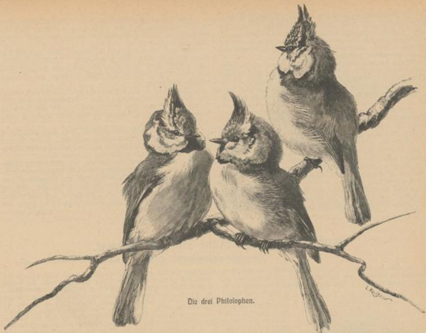
Die drei Philosophen.