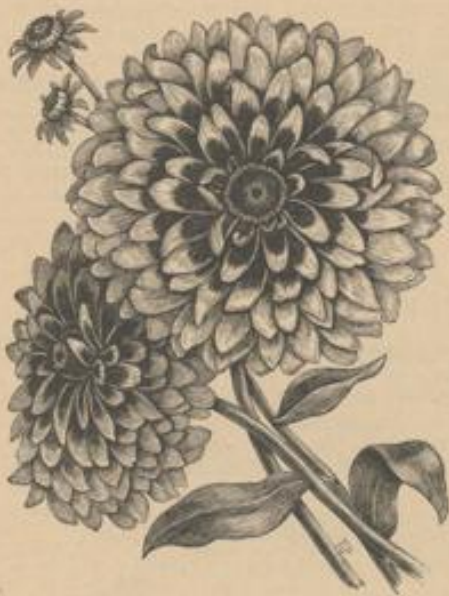
Rudbeckia bicolor superba.

Aus der im Jahre 1898 eingeführten fortblühenden Pflanze Rudbeckia bicolor superba haben Haage & Schmidt in Erfurt eine fast gefüllte blühende Varietät erzielt, deren Effect besonders glänzend ist.