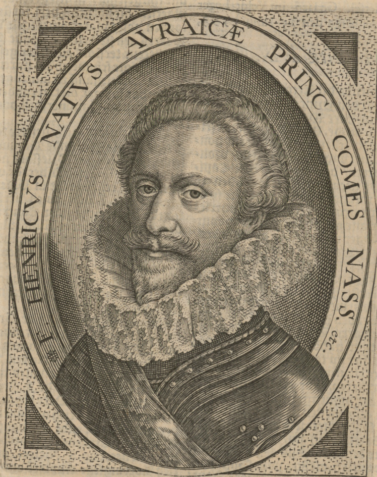
FRED. HENDRICK, Geboren Prince van Orangnen, Grave van Nassau, Catzenellebogen, Dietz ende Vyanden, &c. Heer van S. Geertruydenberghe, vande Hooge ende Lage Svalurve, Naeldrvyck, Honsholredijck. &c. Generael vande Cavallerie der Vereenichde Nederlanden, &c.

ten wy al eer wy voortgaen met onse Historiale verclaringe alhier in boegen / de afbeeldinghe / daden / ende gheschiedenissen vanden selven Prince.