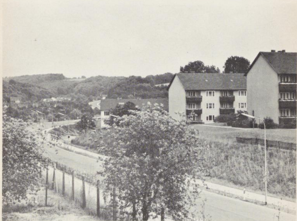
Blick auf die L.I.O. 294, rechts die Gagfah-Siedlung, im Hintergrund die Ortschaft Büscherhöfen