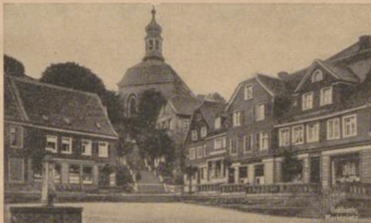
MARKTPLATZ IN SOLINGEN-GRÄFRATH