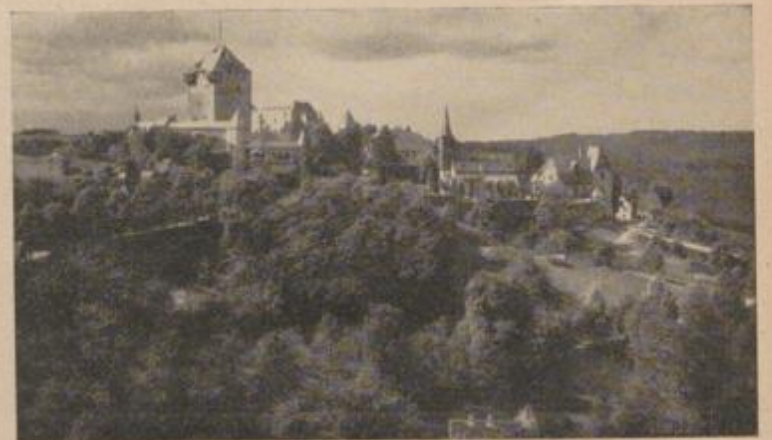
SCHLOSS BURG AN DER WUPPER