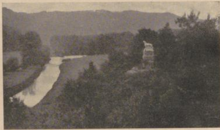
DER RÜDENSTEIN BEI SOLINGEN-WIDDERT