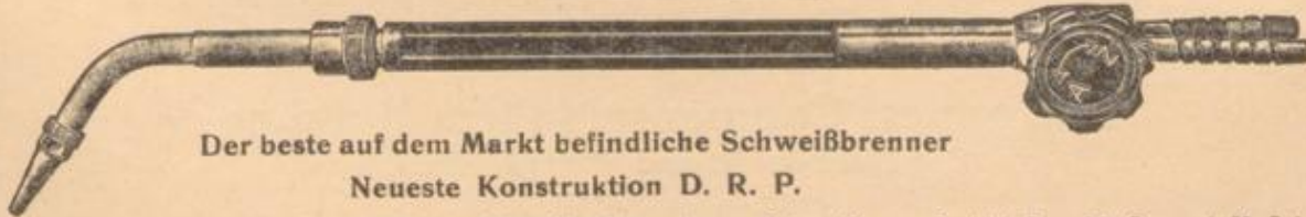
Der beste auf dem Markt befindliche Schweißbrenner Neueste Konstruktion D. R. P.

Kaufen Sie keine minderwertigen Nachahmungen