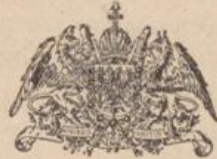
Kammerlieferant Sr. Maj. d. Kaisers v. Oesterreich Königs v. Ungarn

U H. UNDERBERG-ALBRECHT U Gegr. 1846 RHEINBERG/RHLD. Gegr. 1846