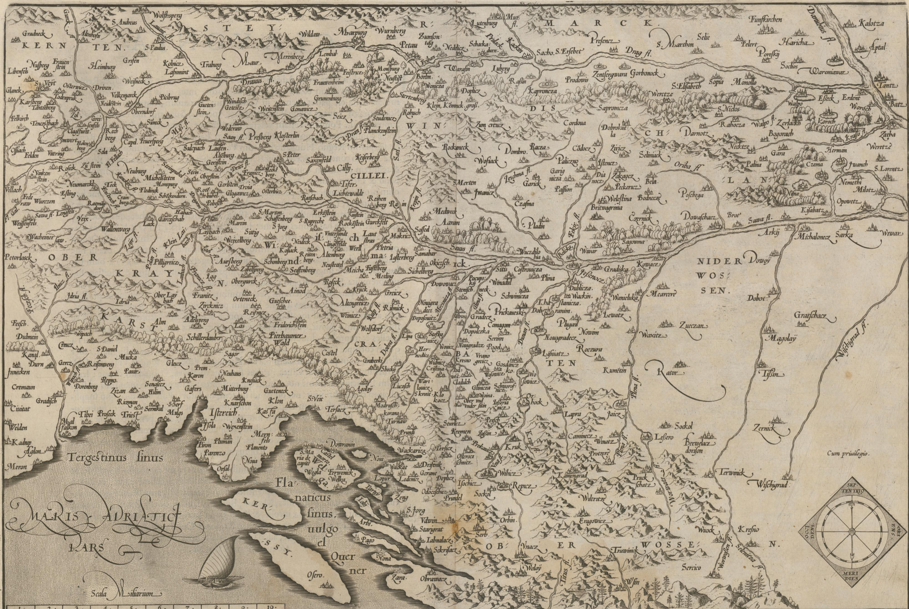
B SCHLAVONIAE, CROATIAE, CARNIAE, ISTRIAE, BOSNIAE, FINITIMARVMQVE REGIONVM NOVA DESCRIPTIO, AVCTORE AVGVSTINO HIRSVOGELIO. B